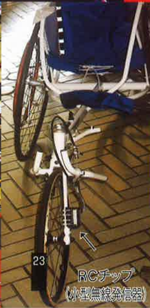
RCチップ (小型無線送信器)