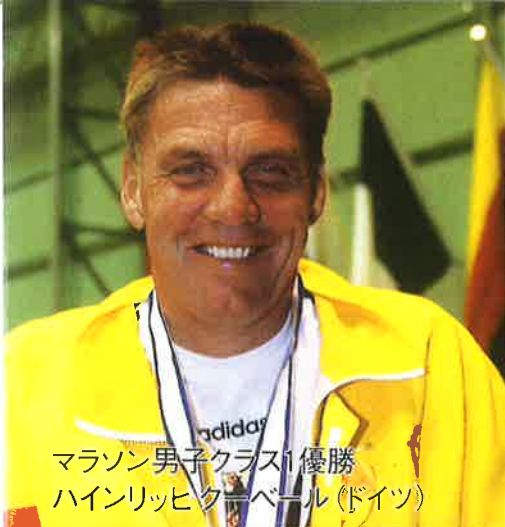
マラソン男子クラス1優勝 ハインリッヒクーパー(ドイツ)