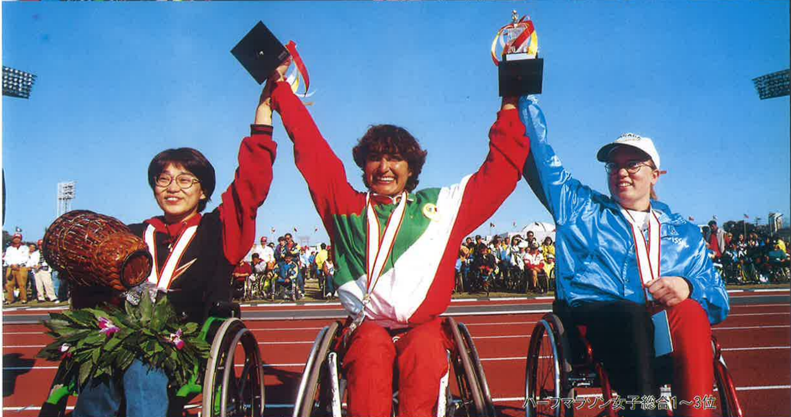
ハーフマラソン女子総合1~3位