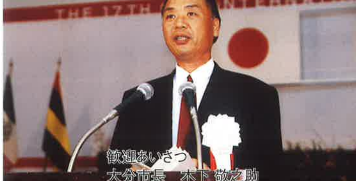
歓迎あいさつ 大分市長 木下 敬之助