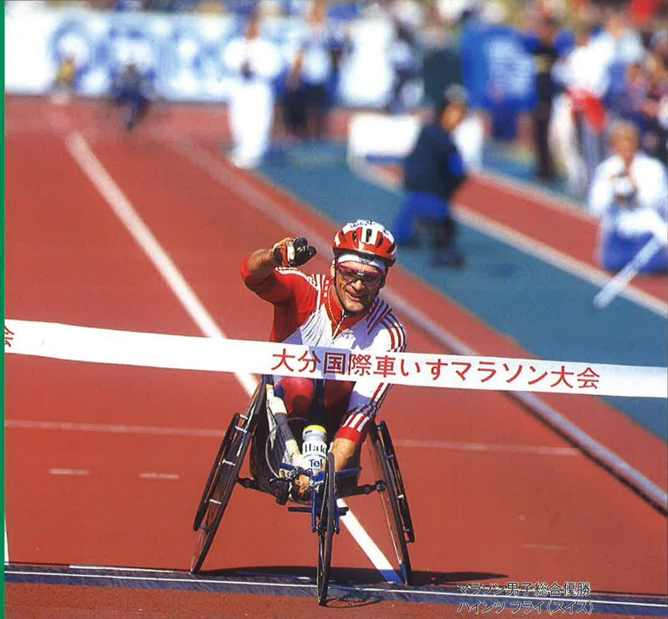
マラソン男子総合優勝 ハインツ フライ(スイス)