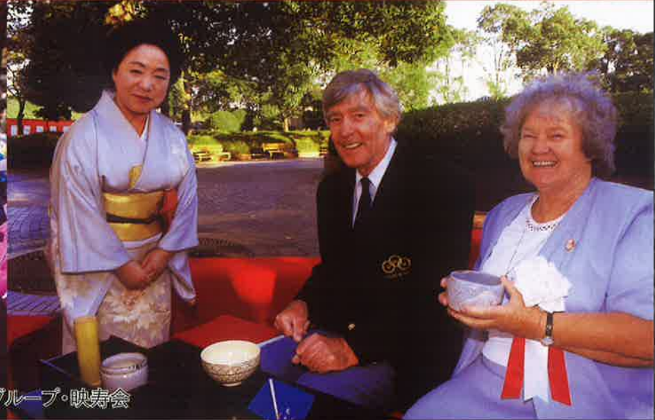
ボランティアグループ・映写会