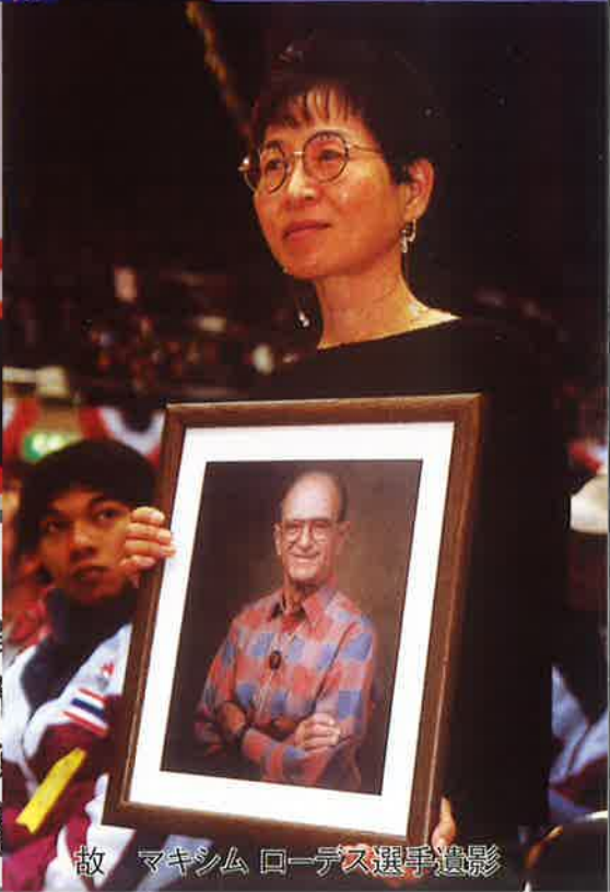
故 マキシム ローデス選手遺影