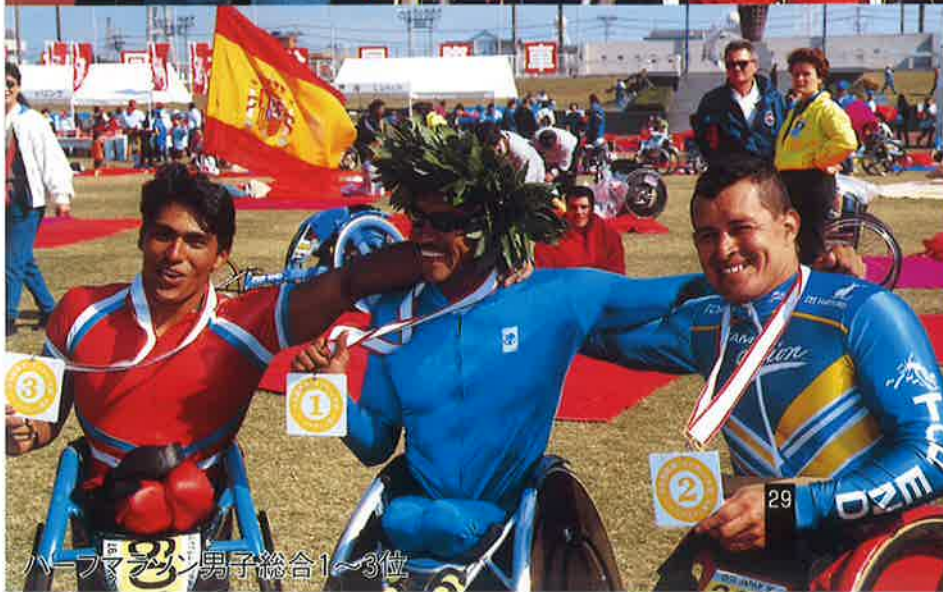
ハーフマラソン男子総合1~3位