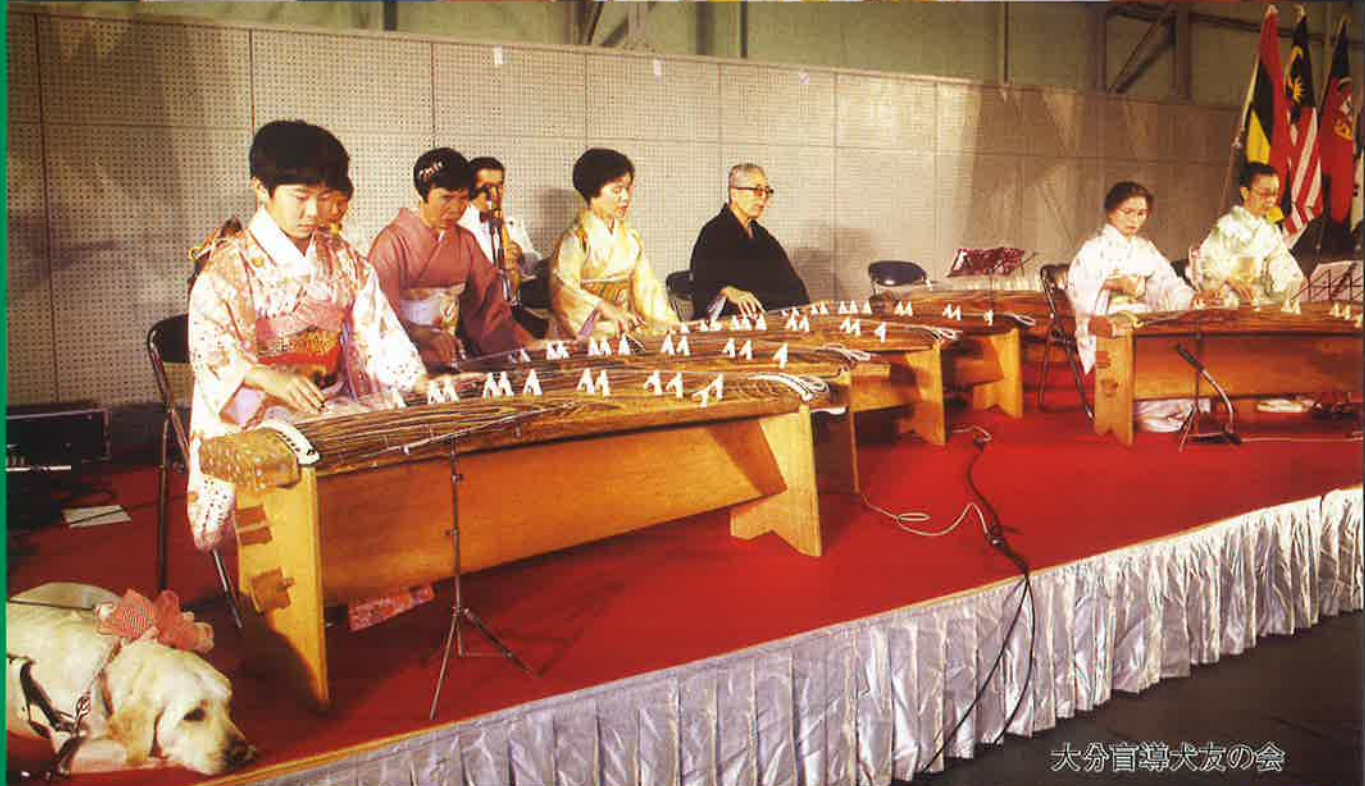
大分盲導犬友の会