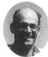
ハインツ フライ(スイス) Heinz Frei(Switzerland) マラソン男子総合5連覇、7度の優勝 (第10~11、13~17回大会) 世界記録保持者