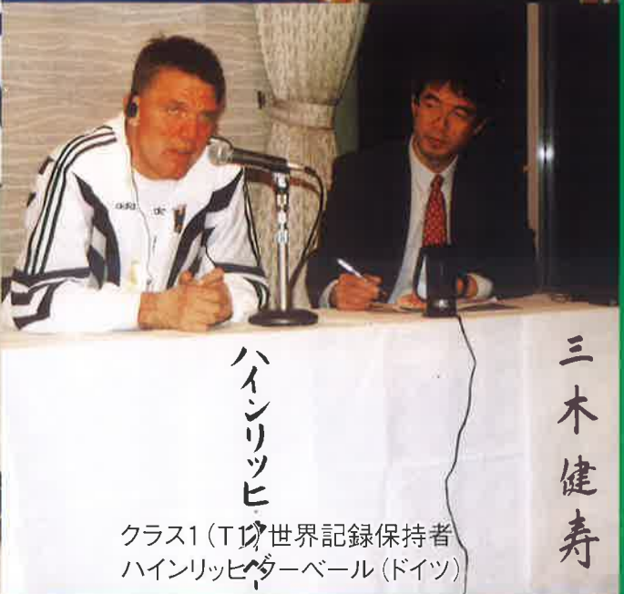
ハインリッヒ クラス1 (T1) 世界記録保持者 ハインリッヒヘーデル (ドイツ)