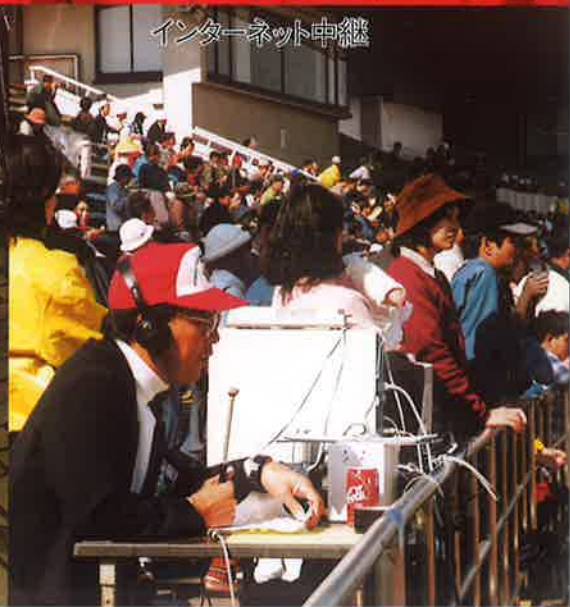
インターネット申継