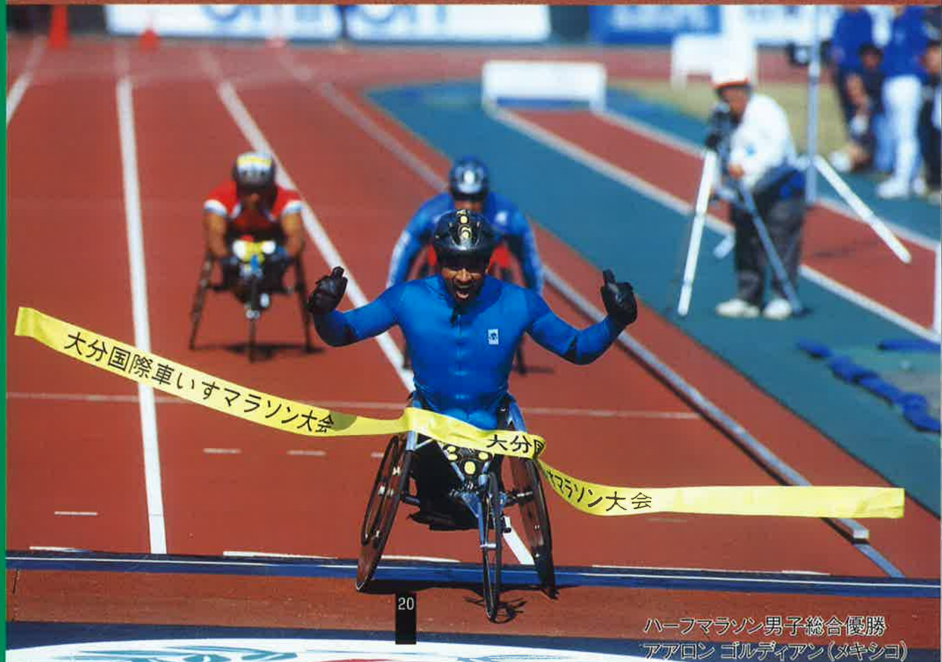
ハーフマラソン男子総合優勝 アアロン ゴルディアン(メキシコ)