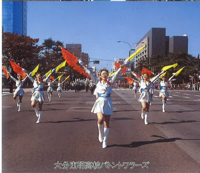
大分東明高校バントワラーズ