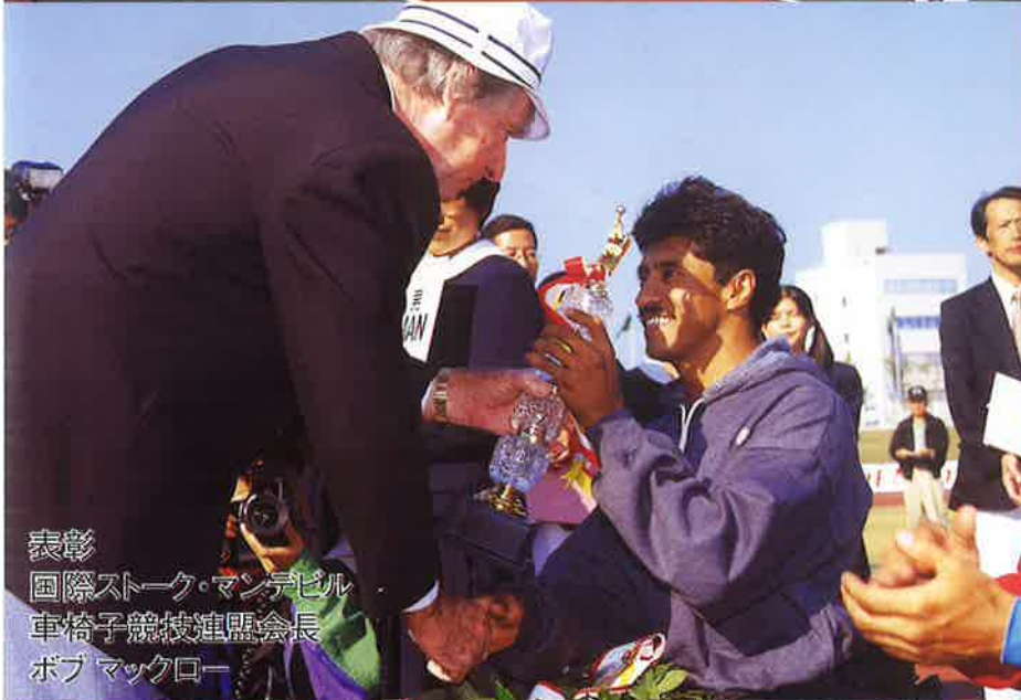
表彰 国際ストック・マンデビル 車椅子競技連盟会長 ボブ マックロー