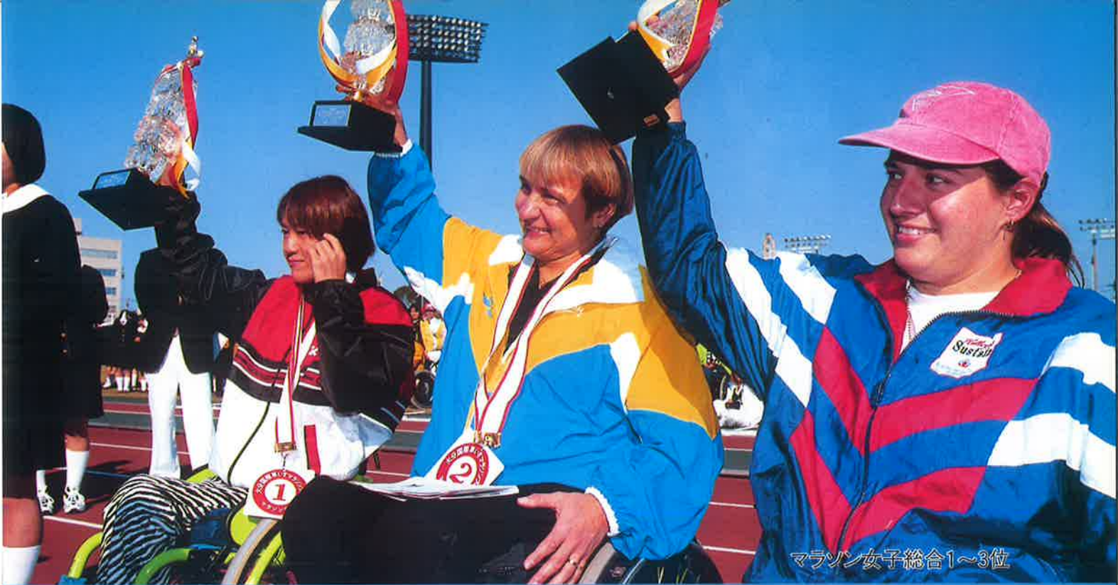
マラソン女子総合1~3位