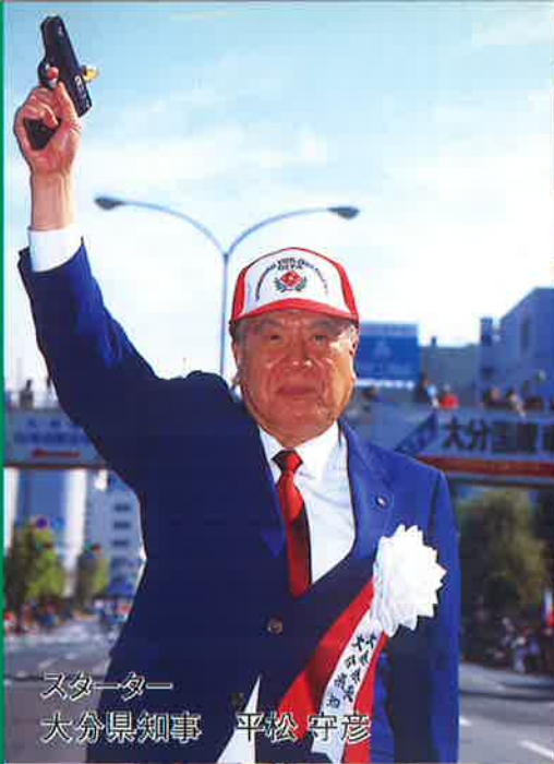
スタート 大分県知事 平松 守彦