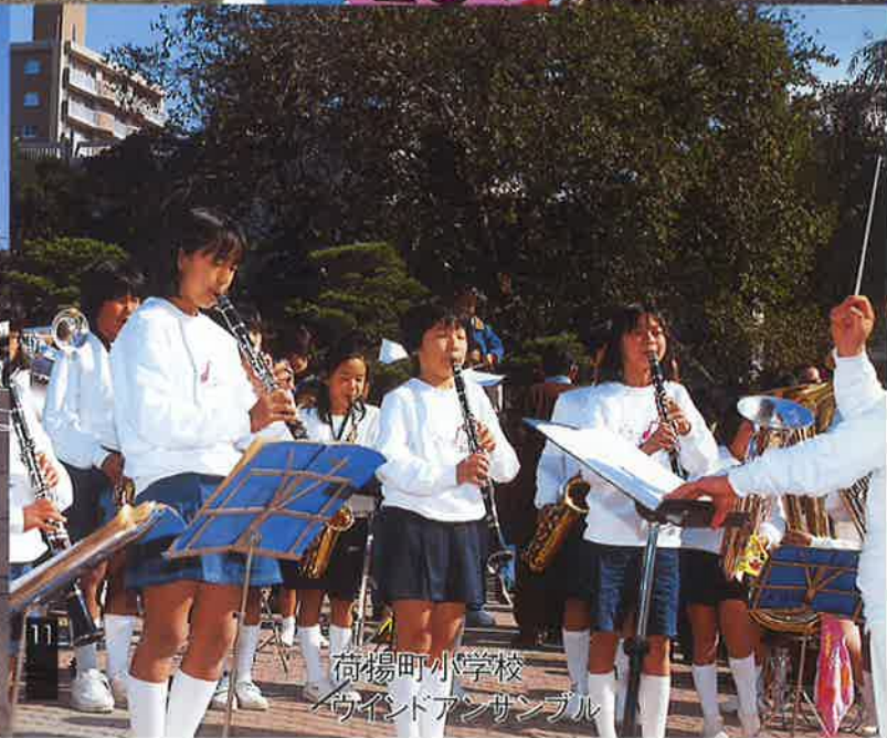
荷揚町小学校 ウインドアンサンブル