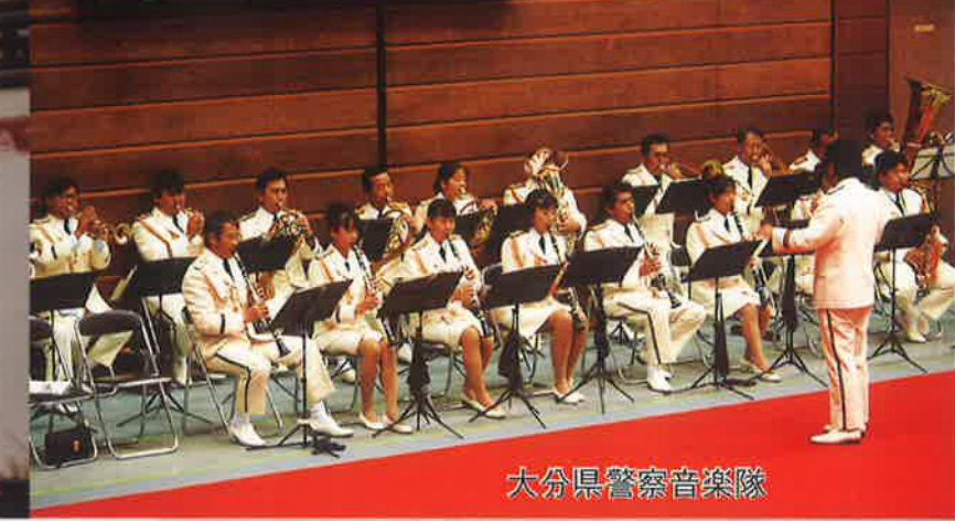
大分県警察音楽隊