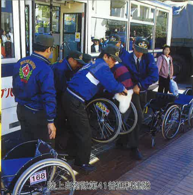
陸上自衛隊第41普通科連隊