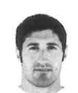
エレンスト・ヴァン・ダイク(南アフリカ) ERNST VAN DYK (South africa)