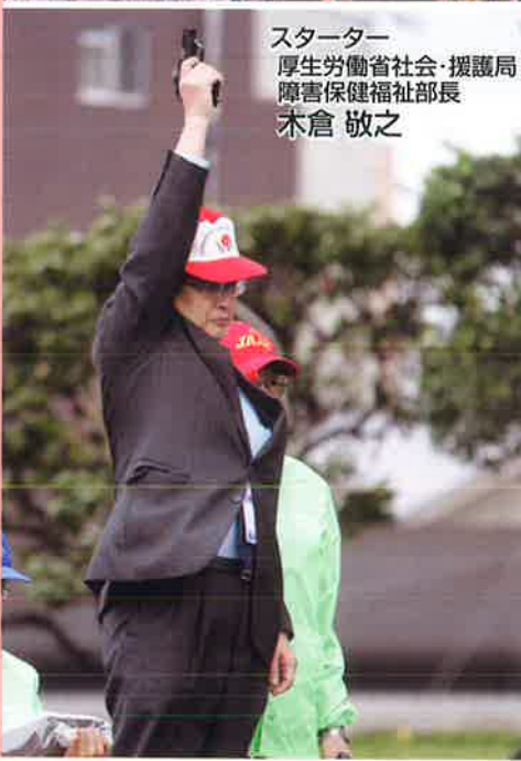
スターター 厚生労働省社会・援護局 障害保健福祉部長 木倉 敬之