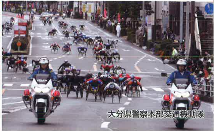
大分県警察本部交通機動隊