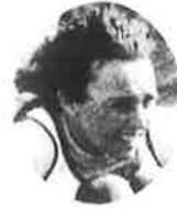
キャンデス・ケーブル(アメリカ) CANDACE CABLE (U.S.A.)