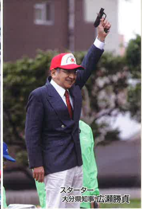
スターター 大分県知事 広瀬勝貞