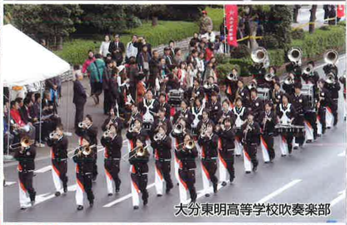
大分東明高等学校吹奏楽部