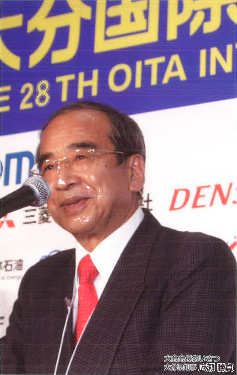
大会会長あいさつ 大分県知事 広瀬 勝貞