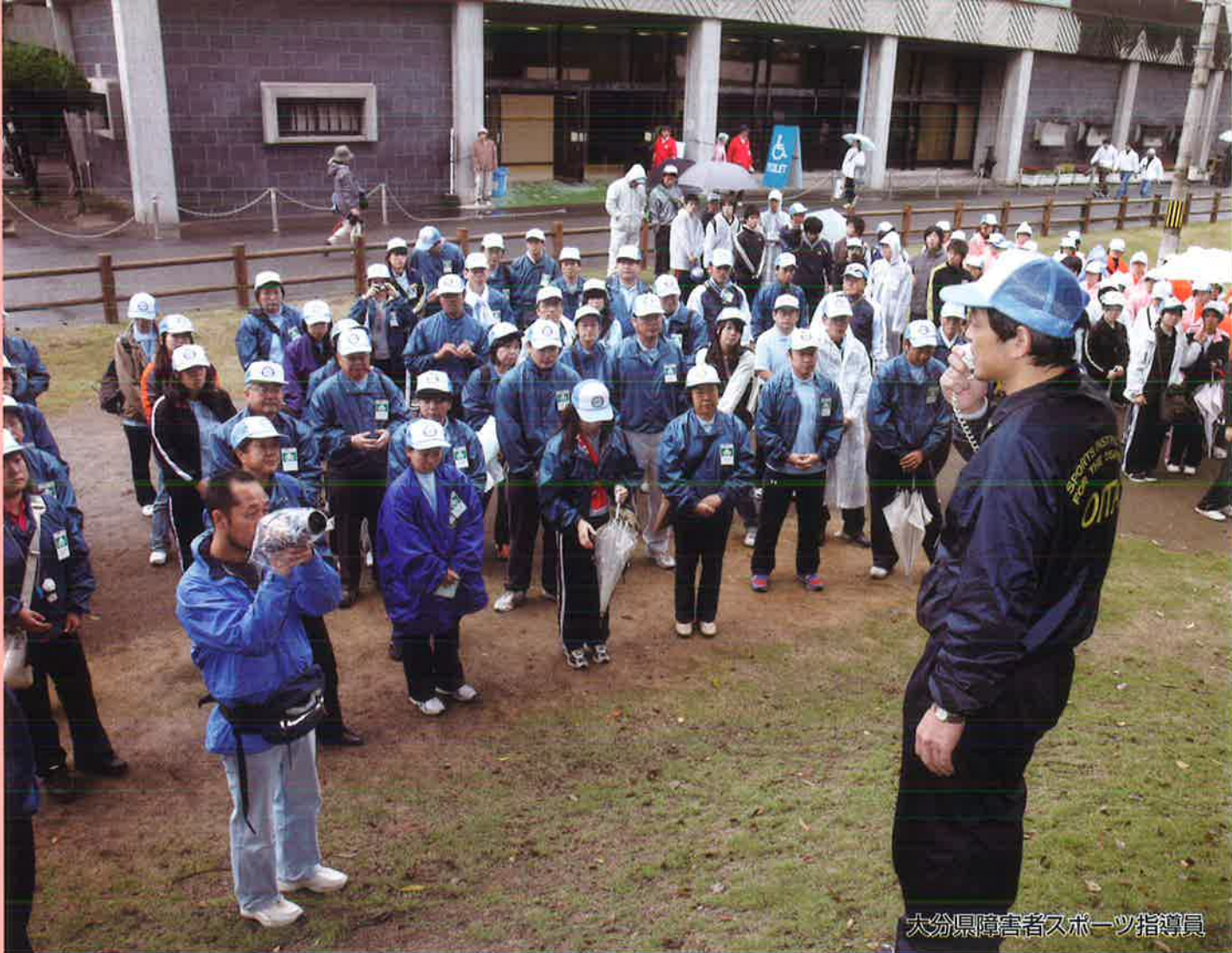
大分県障害者スポーツ指導員