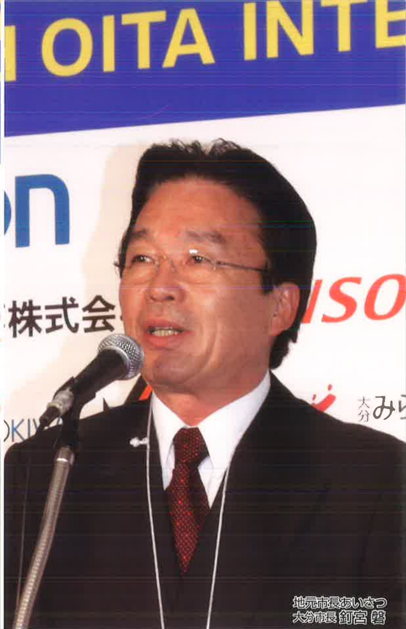
地元市長あいさつ 大分市長 釘宮 啓