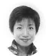
土田 和歌子(東京都) TSUCHIDA WAKAKO (Japan)

マラソン男子総合で日本人として初の2位 入賞(第16回大会) 3度の国内1位(第16、21、22回大会)