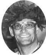
ハインツ・フライ(スイス) HEINZ FREI (Switzerland)

マラソン男子総合10連覇、13度の優勝 (第10、11、13~22、28回大会) 世界記録保持者