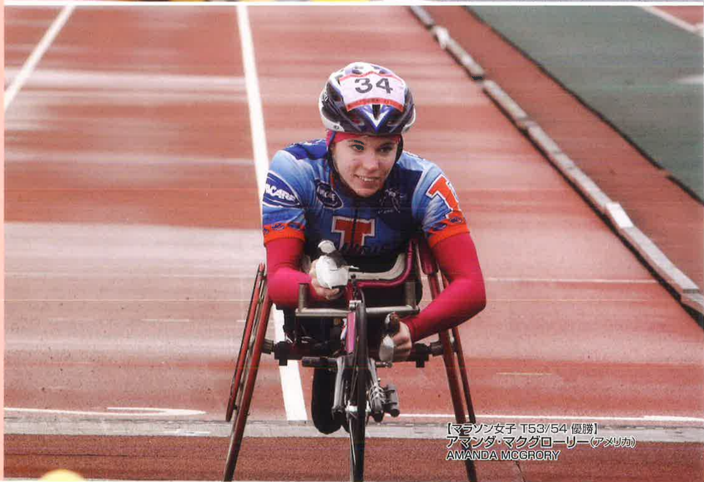
【マラソン女子 T53/54 優勝】 アマンダ・マクグローリー(アメリカ) AMANDA MCGRORY