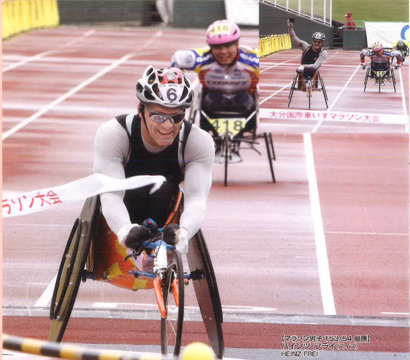
【マラソン男子 T53/54 優勝】 ハインツ・フライ(スイス) HEINZ FREI