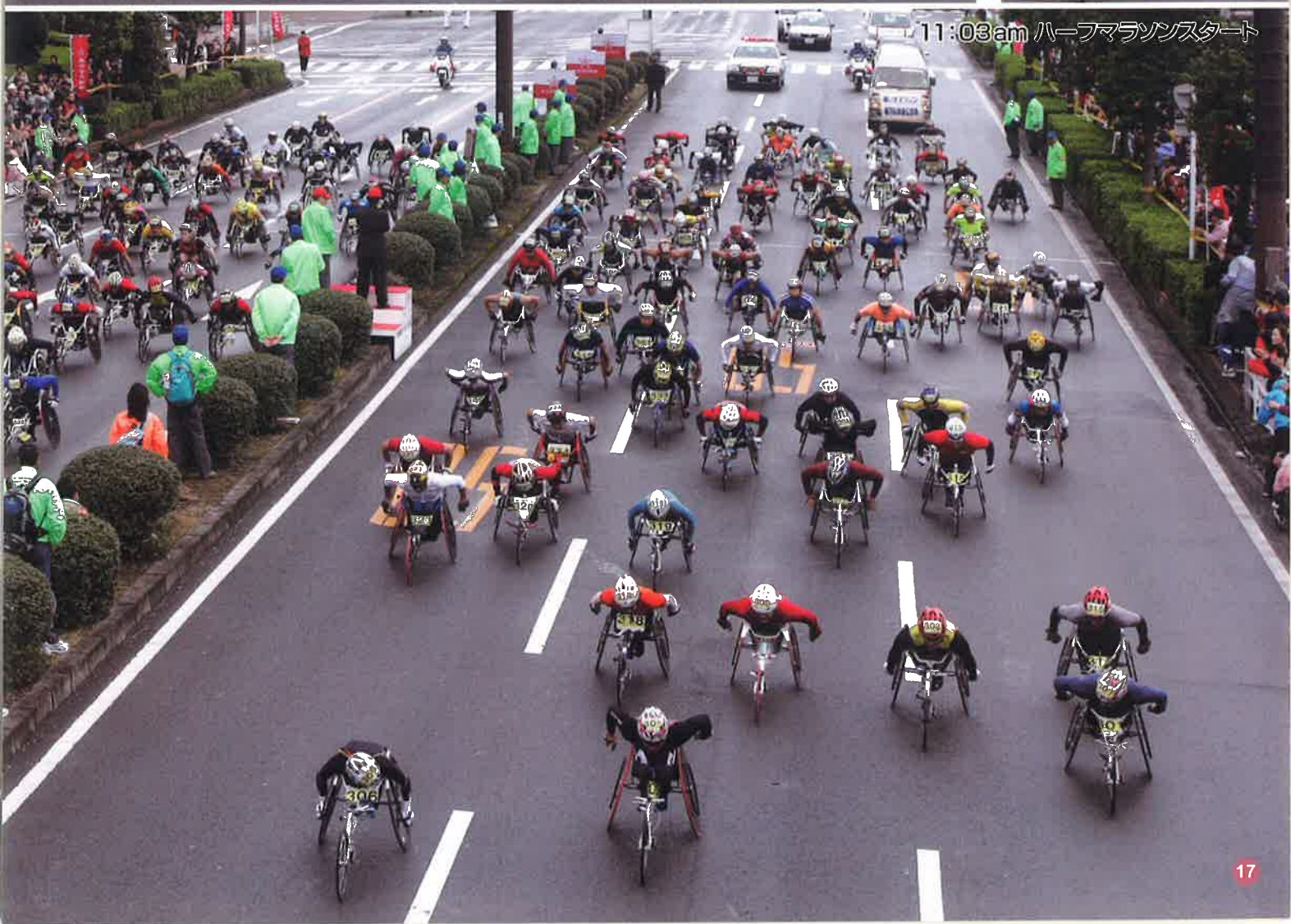
11:03am ハーフマラソンスタート