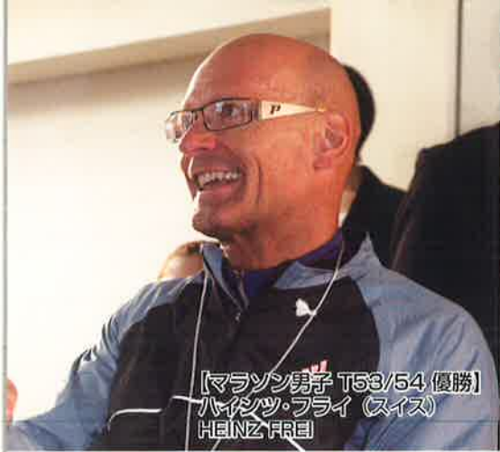
【マラソン男子 T53/54 優勝】 ハインツ・フライ (スイス) HEINZ FREI