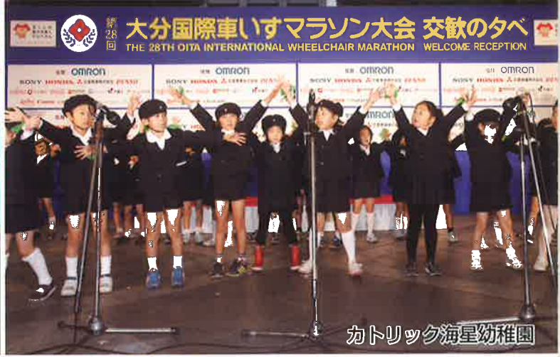
カトリック海星幼稚園