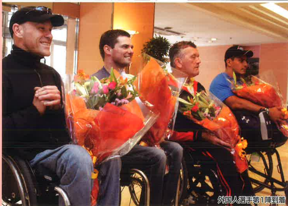
外国人選手第1陣到着