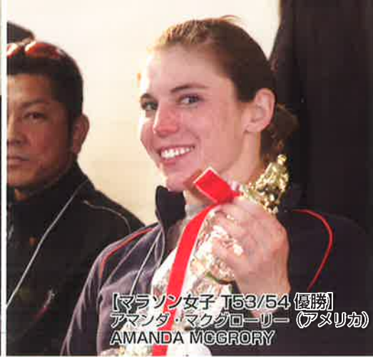
【マラソン女子 T53/54 優勝】 アマンダ・マクグロリー (アメリカ) AMANDA MCGORRY