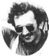
グレゴール・ゴロンベック(西ドイツ) GREGOR GOLOMBEK (West Germany)