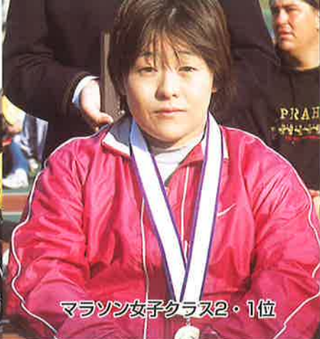
マラソン女子クラス2・1位