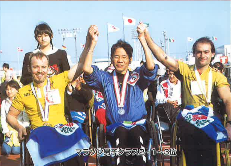
マラソン男子クラス2・1~3位