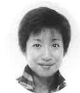
土田 和歌子(東京都) TSUCHIDA WAKAKO (Japan)

マラソン男子総合で日本人として初の2位 入賞(第16回大会) 3度の国内1位(第16、21、22回大会)