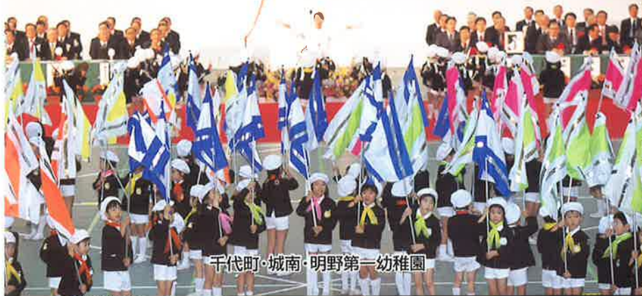
千代町・城南・明野第一幼稚園

駆けぬけろ 情熱 呼びおこせ 感動 "Race with passion Arouse your emotion"