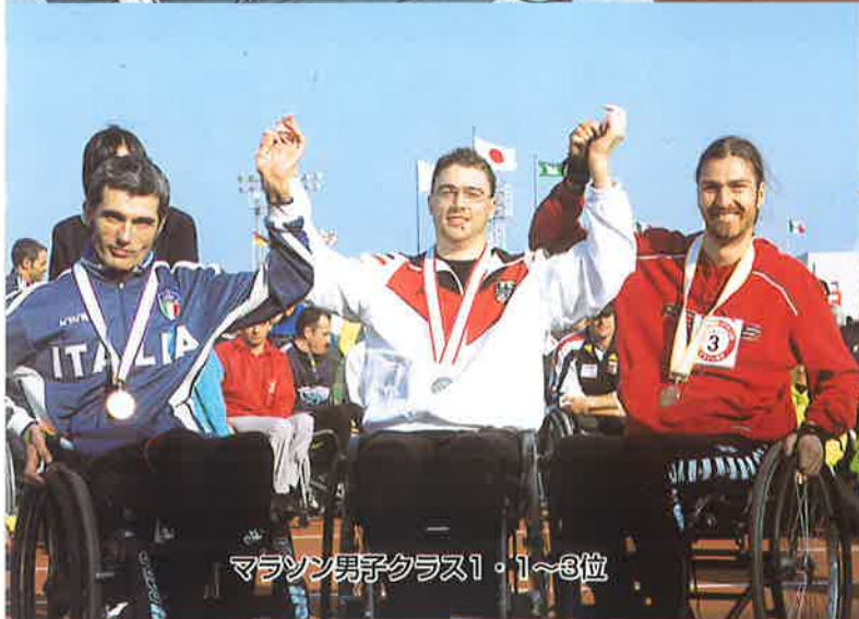
マラソン男子クラス1・1~3位