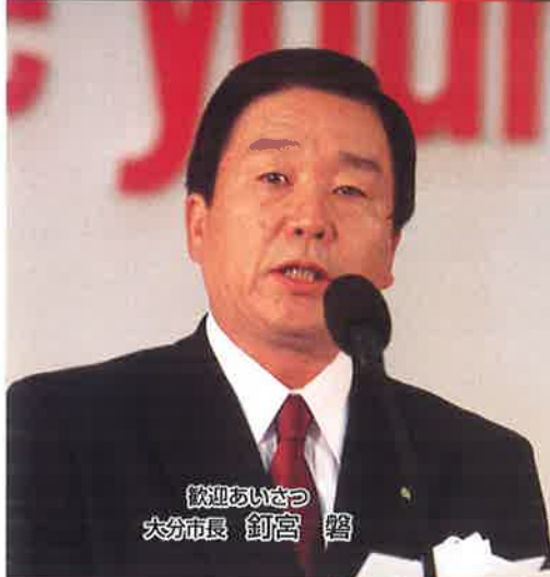
歓迎あいさつ 大分市長 釘宮 馨