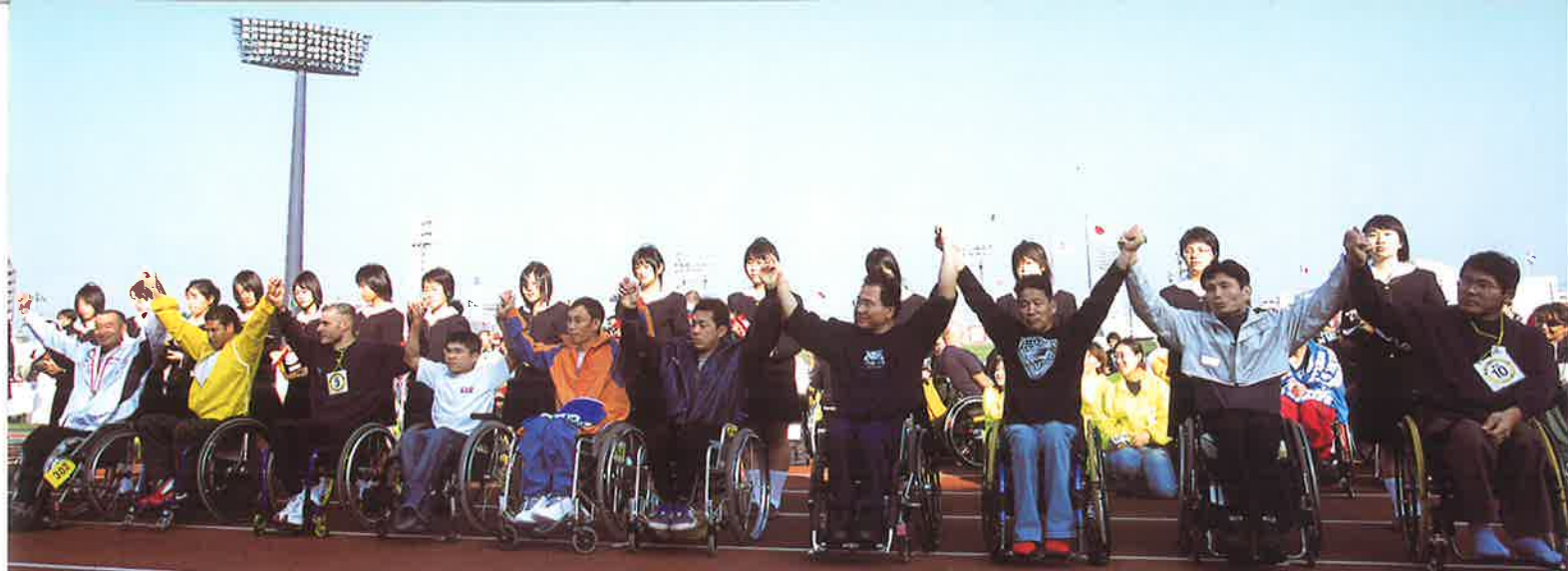
ハーフマラソン男子総合1~10位