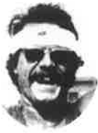
ゲオルグ・フロイント(オーストリア) GEORG FREUND (Austria)