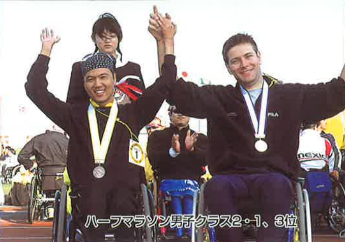
ハーフマラソン男子クラス2・1、3位