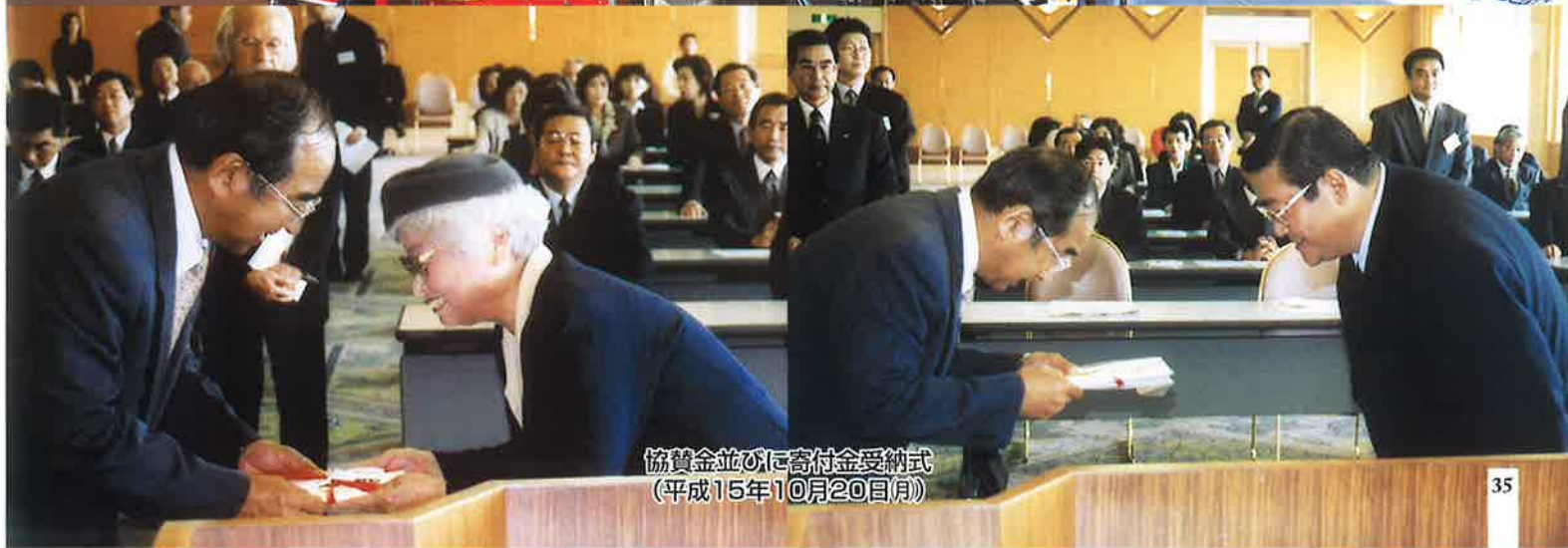
協賛金並びに寄付金受納式 (平成15年10月20日月)