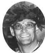
ハインツ・フライ(スイス) HEINZ FREI (Switzerland)

マラソン男子総合10連覇、12度の優勝 (第10、11、13~22回大会) 世界最高記録保持者