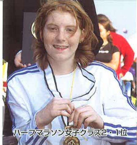
ハーフマラソン女子クラス2・1位