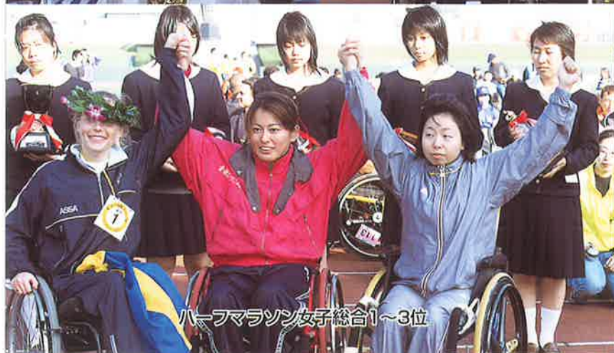
ハーフマラソン女子総合1~3位