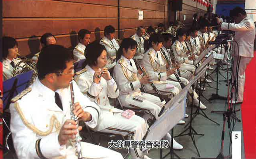
大分県警察音楽隊