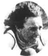
キャンデス・ケーブル(アメリカ) CANDACE CABLE (U.S.A.)