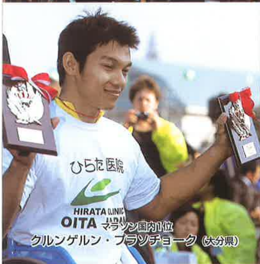
クルンゲルン・ブラソチヨーク (大分県)