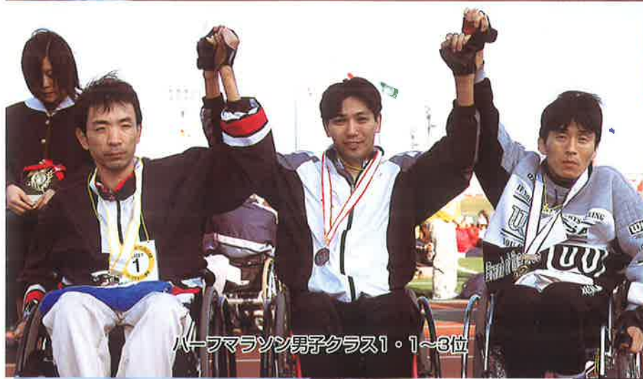
ハーフマラソン男子クラス1・1~3位