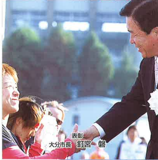
表彰 大分市長 釘宮 馨