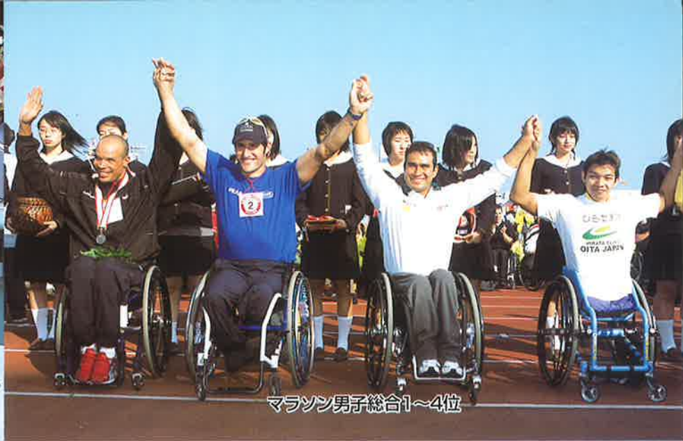
マラソン男子総合1~4位