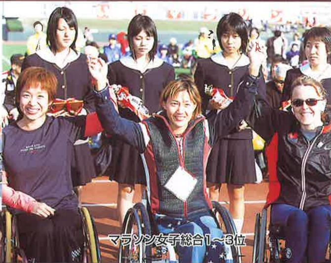
マラソン女子総合1~3位