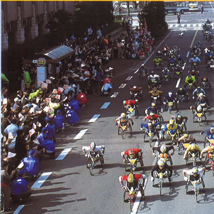
ハーフマラソンスタート