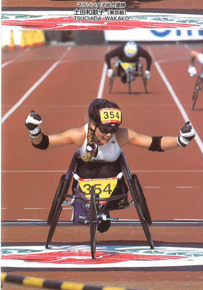
ハーフマラソン女子総合優勝 ジェニー・ルンドブラッド (スウェーデン) JENNY LUNDBLAD