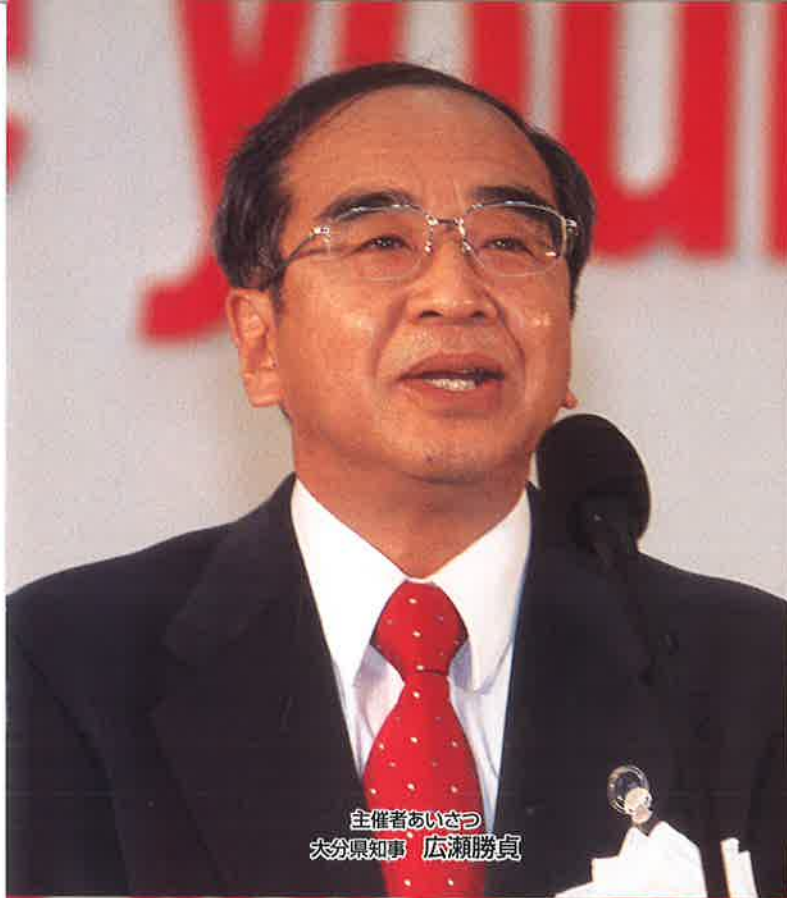
主催者あいさつ 大分県知事 広瀬勝貞