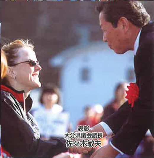
表彰 大分県議会議長 佐々木敏夫