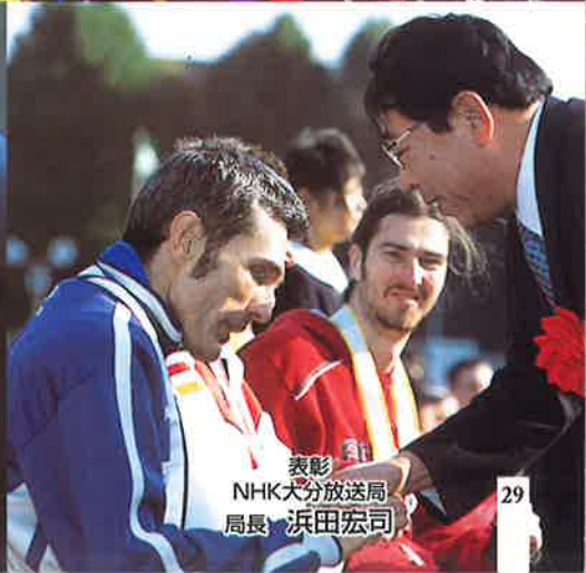
表彰 NHK大分放送局 局長 浜田宏司