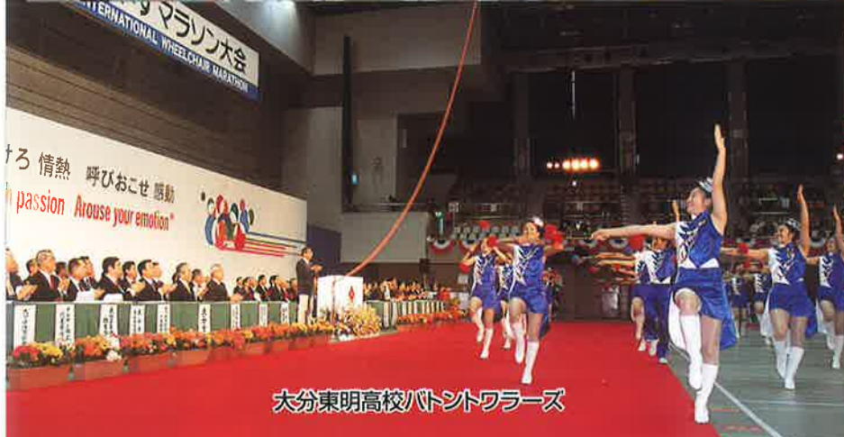
大分東明高校バトントワーズ