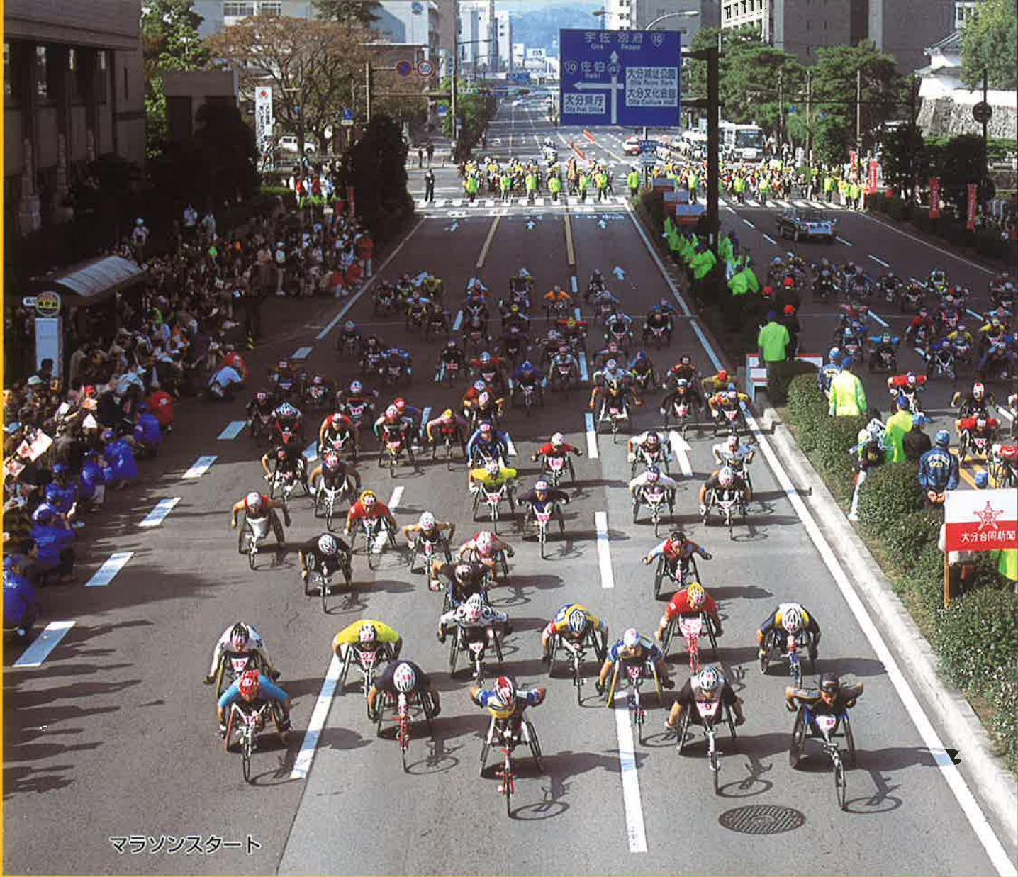
マラソンスタート