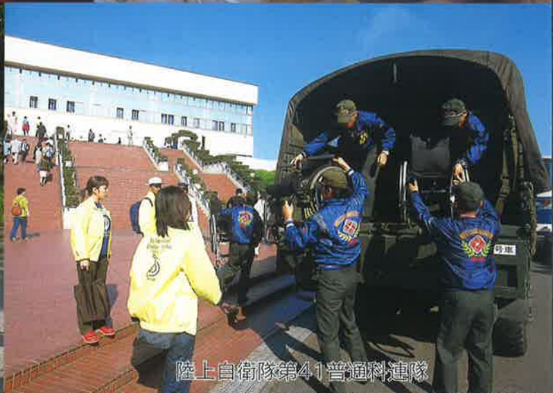
陸上自衛隊第41普通科連隊