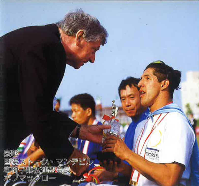
表彰 国際ストック・マンデビル 車椅子競技連盟会長 ホブマツロー