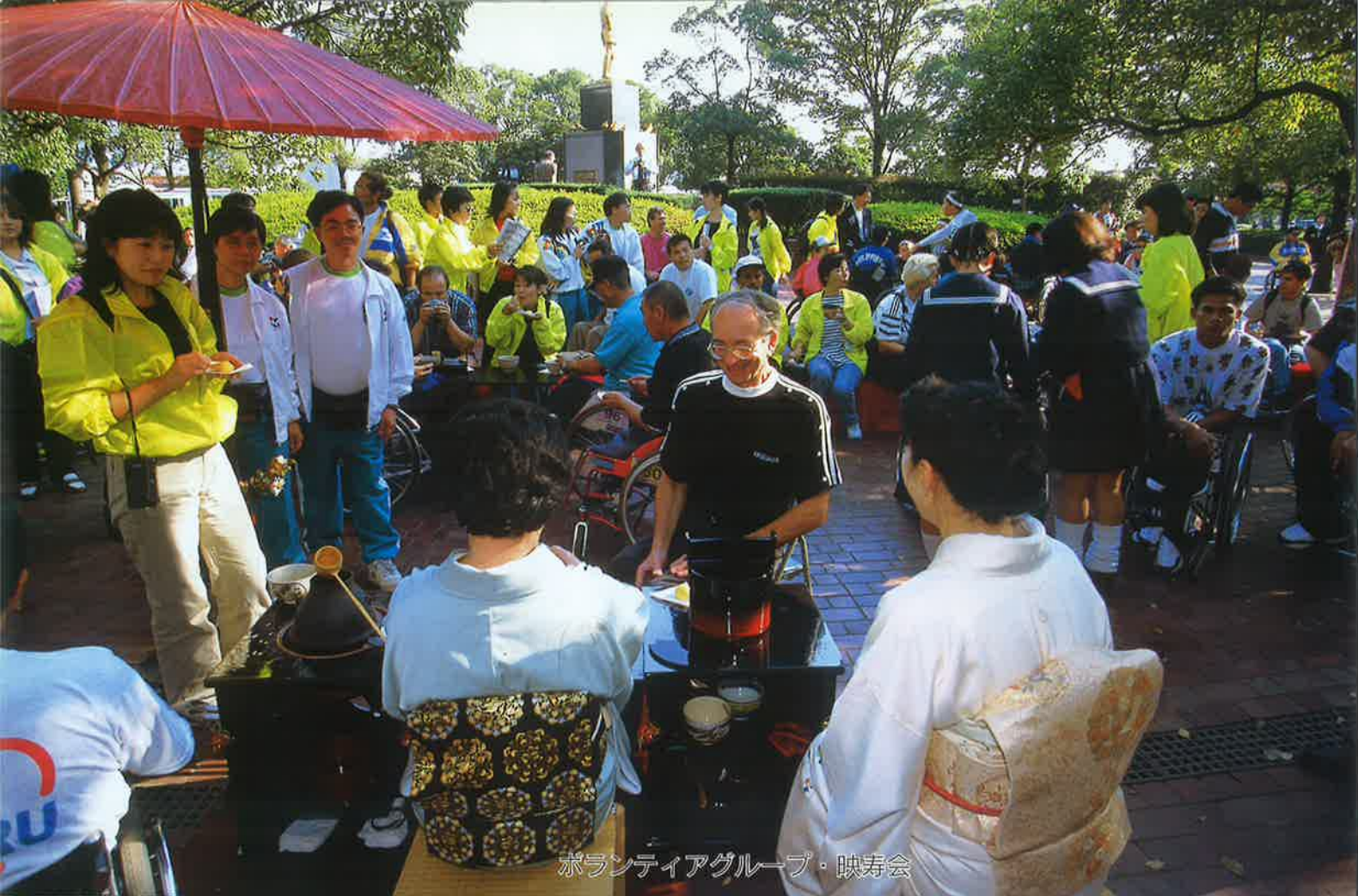
ボランティアグループ・映寿会