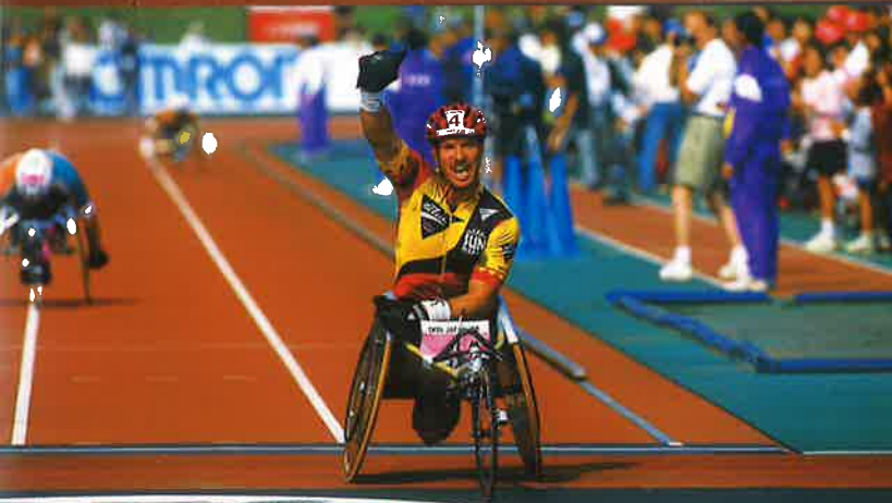
マラソン女子総合優勝 モニカベテルストロム (スウェーデン)