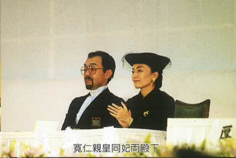
寛仁親皇同妃両殿下