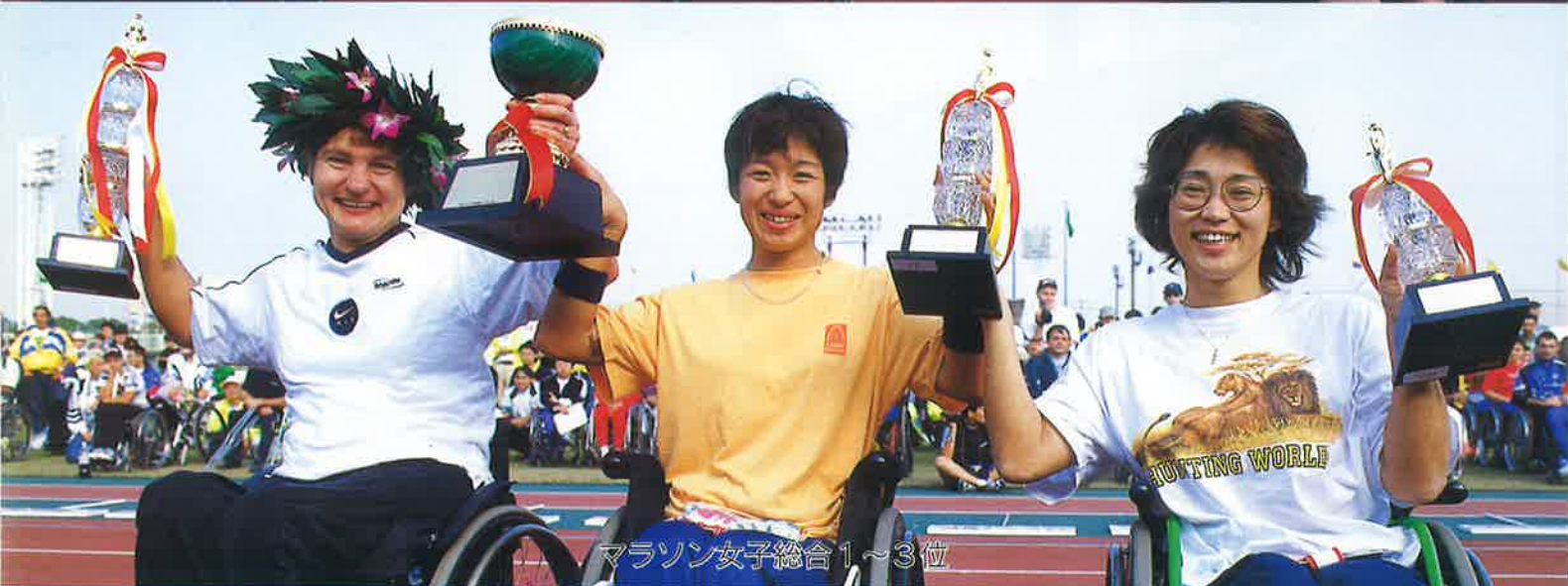
マラソン女子総合1~3位