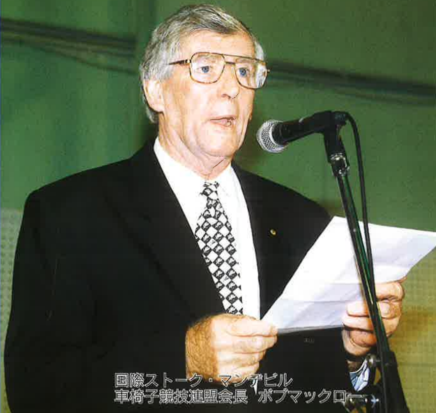
国際ストーク・マンデビル 車椅子競技連盟会長 ポプマックロー