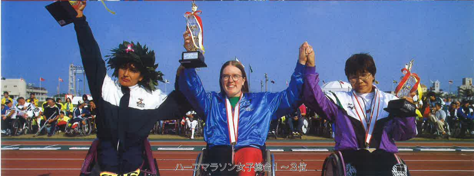
ハーフマラソン女子総合1~3位