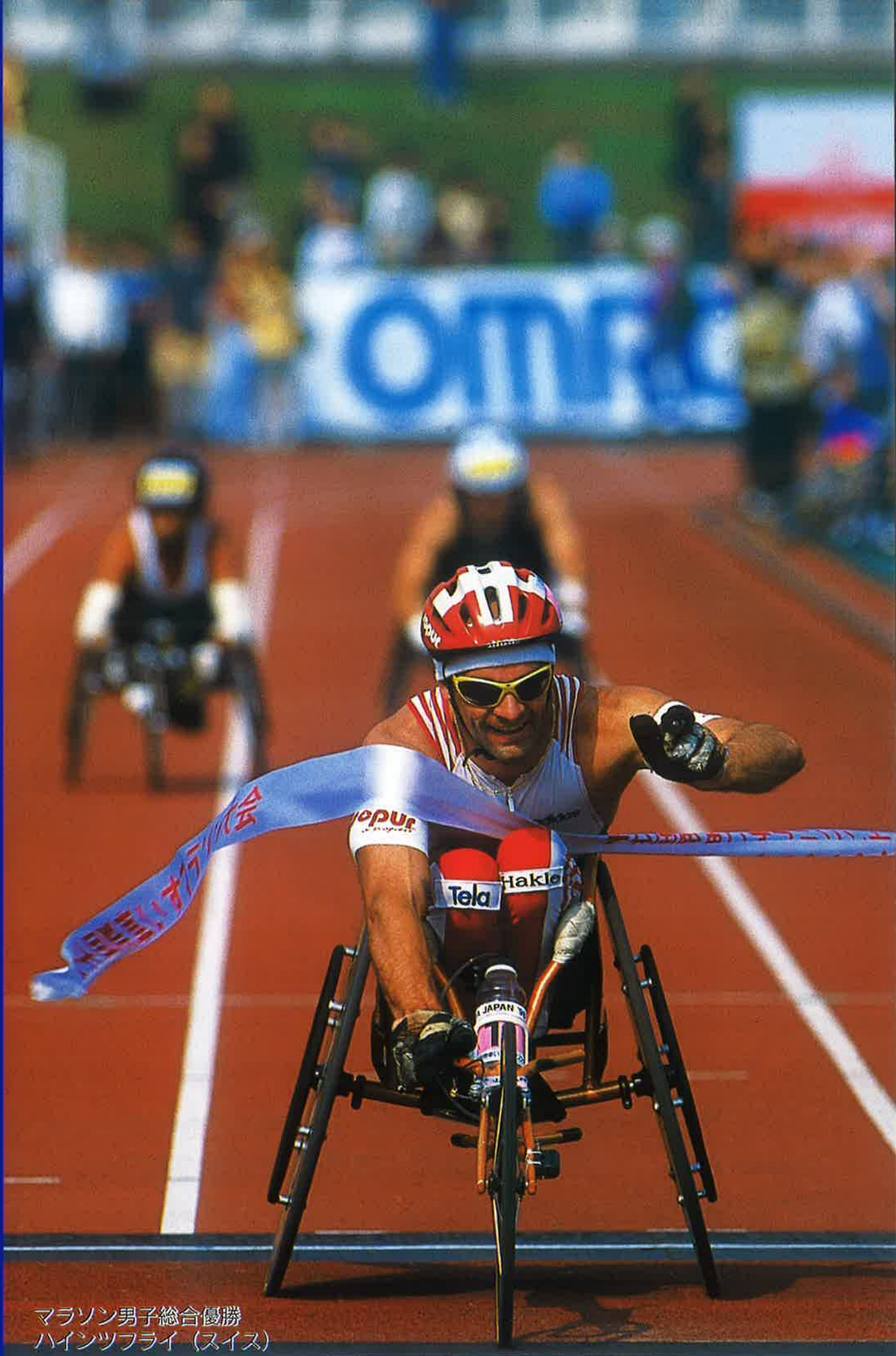
マラソン男子総合優勝 ハインツフライ (スイス)