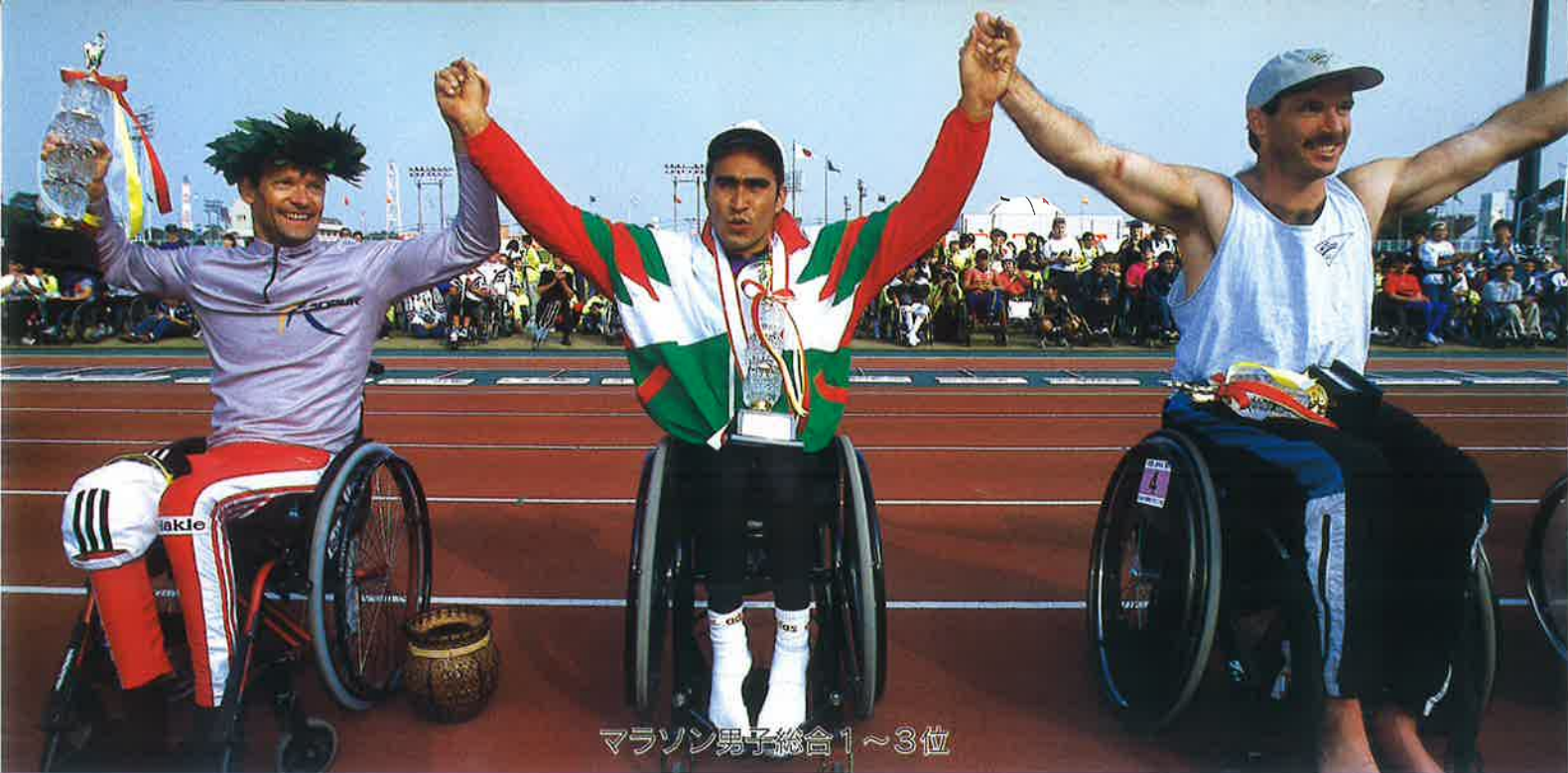
マラソン男子総合1~3位