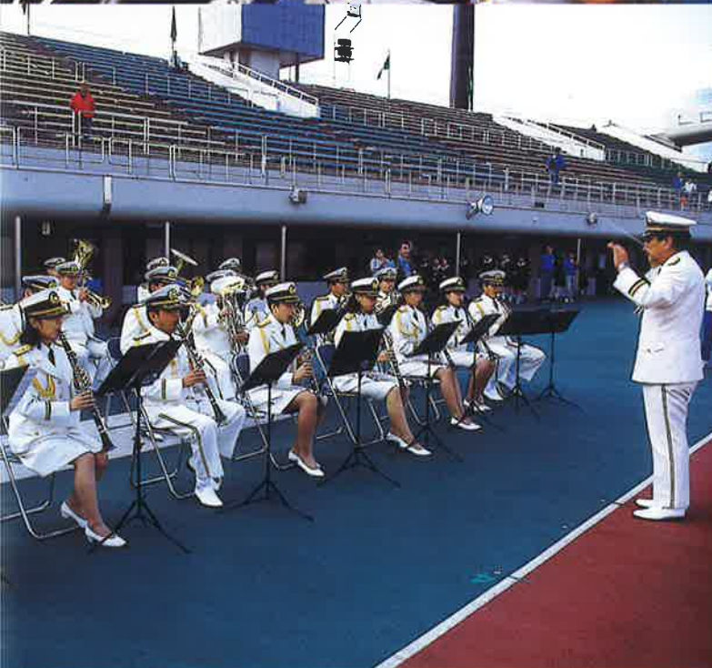
パ ン ク ン