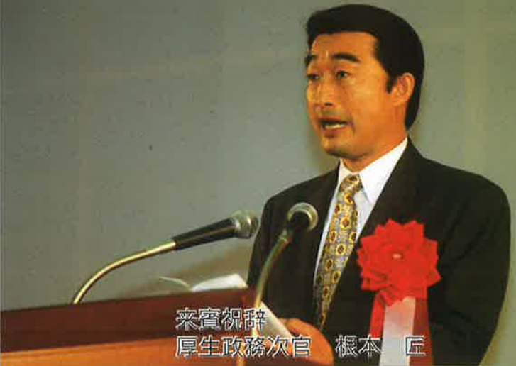
来賓祝辞 厚生政務次官 根本 匠