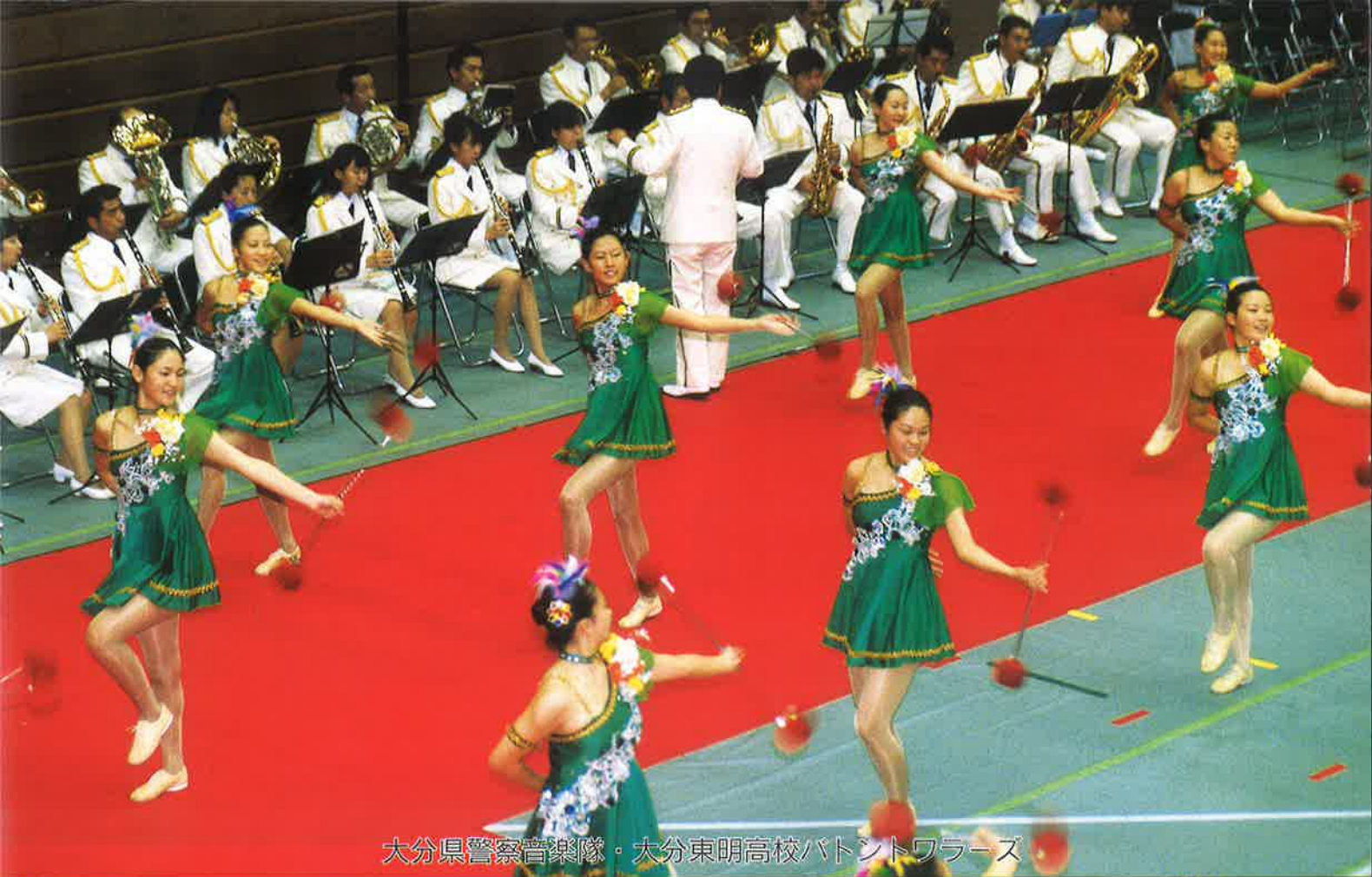
大分県警察音楽隊・大分東明高校バトントワラーズ