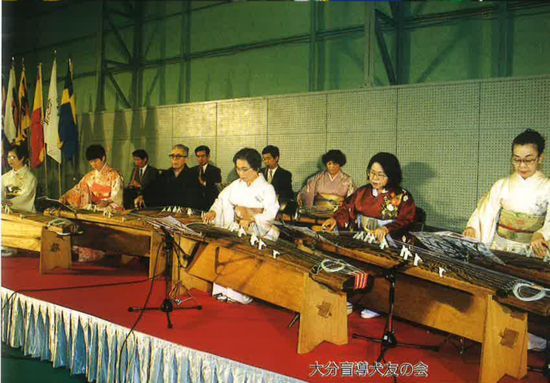
大分盲導犬友の会