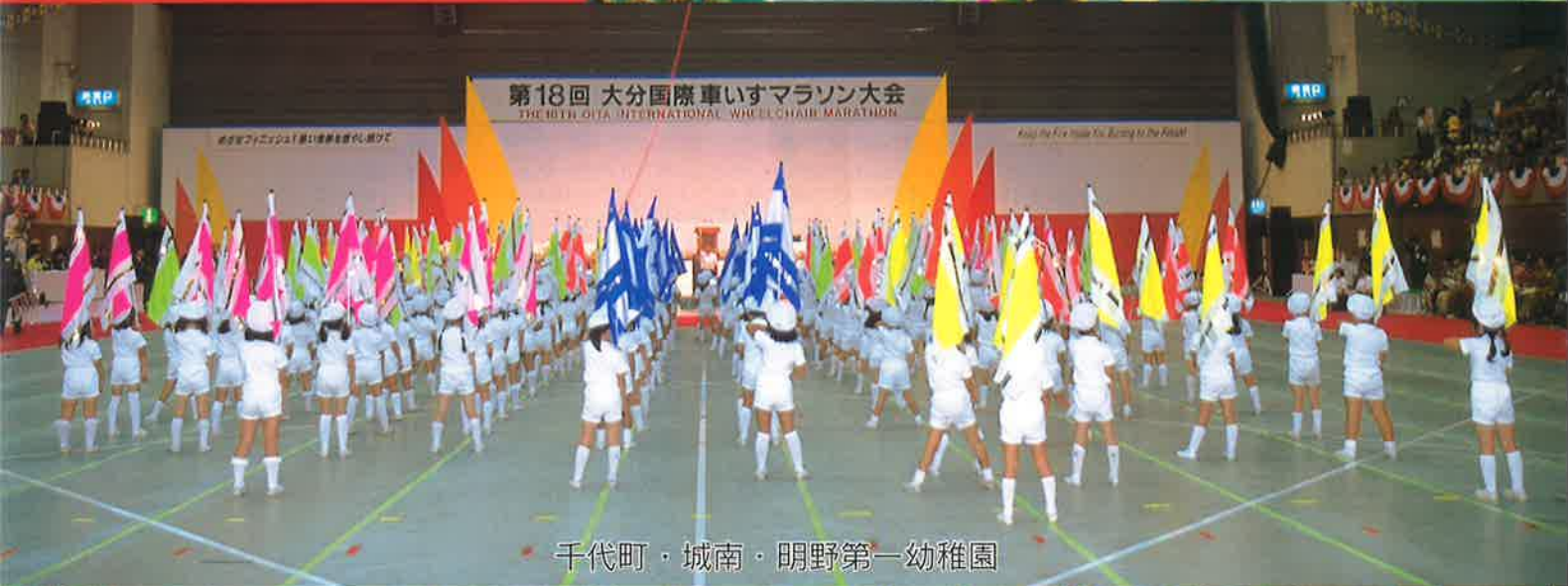
千代町・城南・明野第一幼稚園