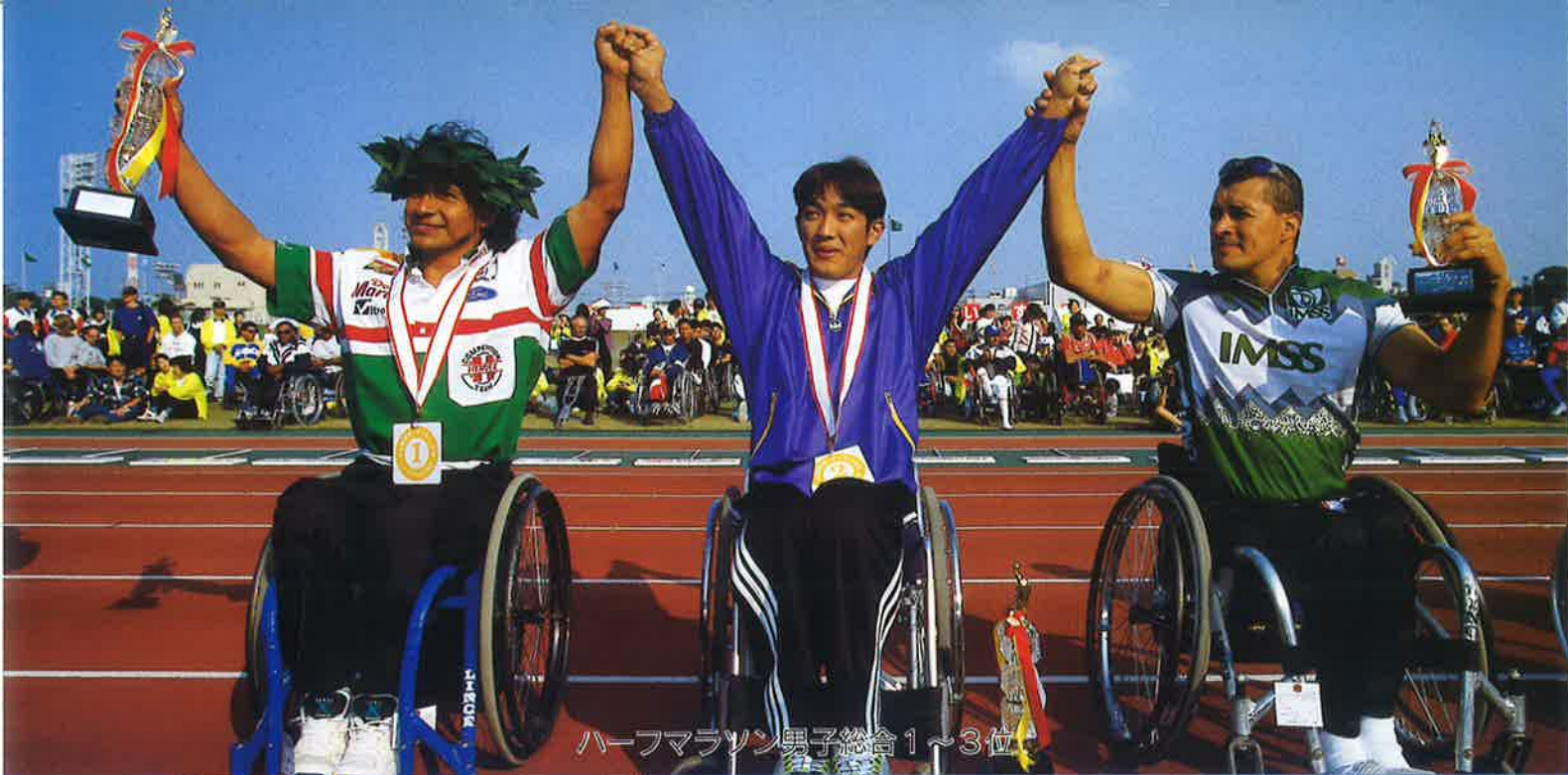
ハーフマラソン男子総合1~3位