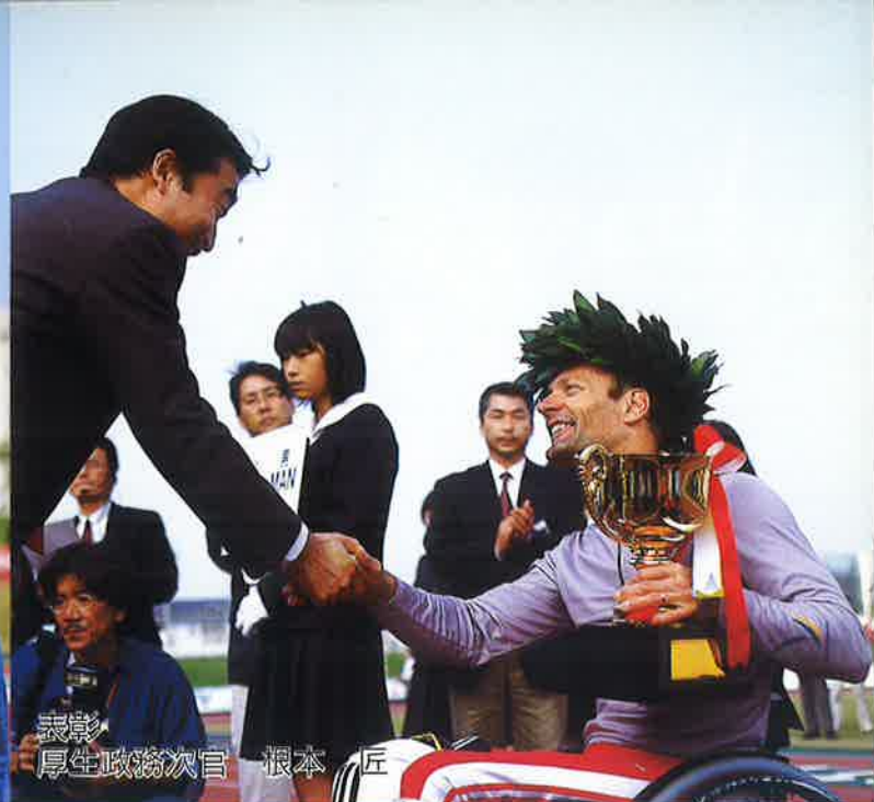
表彰 厚生政務次官 根本 匠