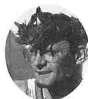
マラソン総合第1位 ハインツ フレイ(スイス) Heinz Frei (Switzerland)