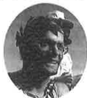
マラソン総合第1位 ハインツ フレイ(スイス) Heinz Frei (Switzerland)