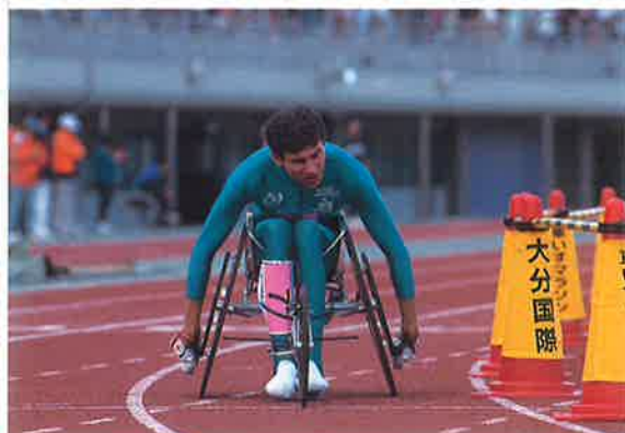
⑦フィリップ・クーブリ選手(フランス)