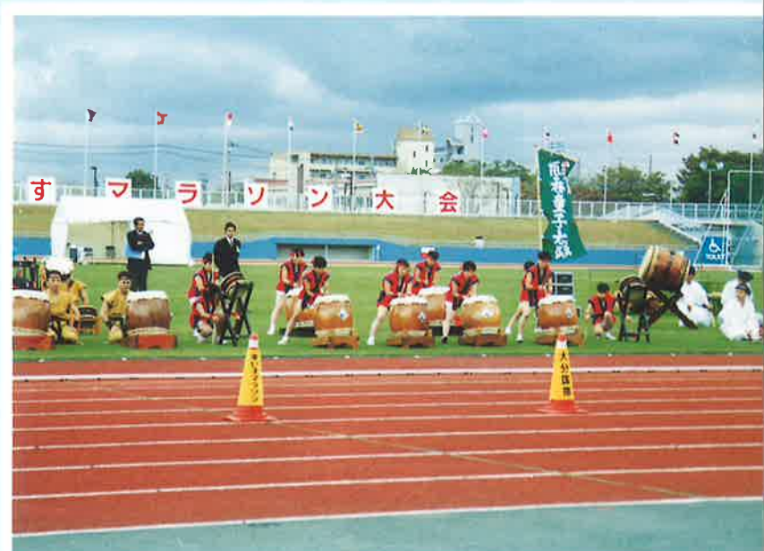
5 社中による太鼓の競演