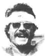
ハーフマラソン総合第1位 ゲオルグ フロント(オーストリア) Georg Freund (Austria)