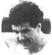
マラソン総合第1位 アンドレ ヴィジェ(カナダ) Andre Viger (Canada)