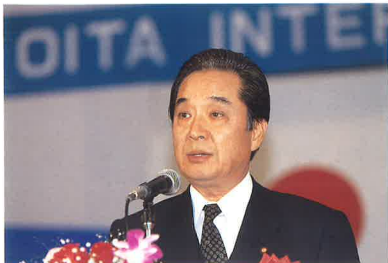
来賓祝辞 厚生大臣 大内啓伍氏