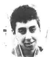
マラソン女子総合第1位 アンジェラ イェリティ(カナダ) Angela Ieriti (Canada)