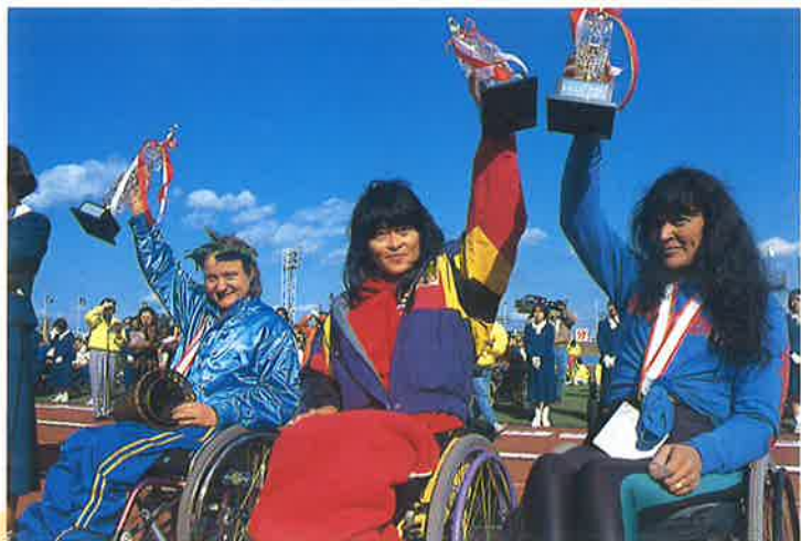
マラソン女子 | 1位～3位入賞者