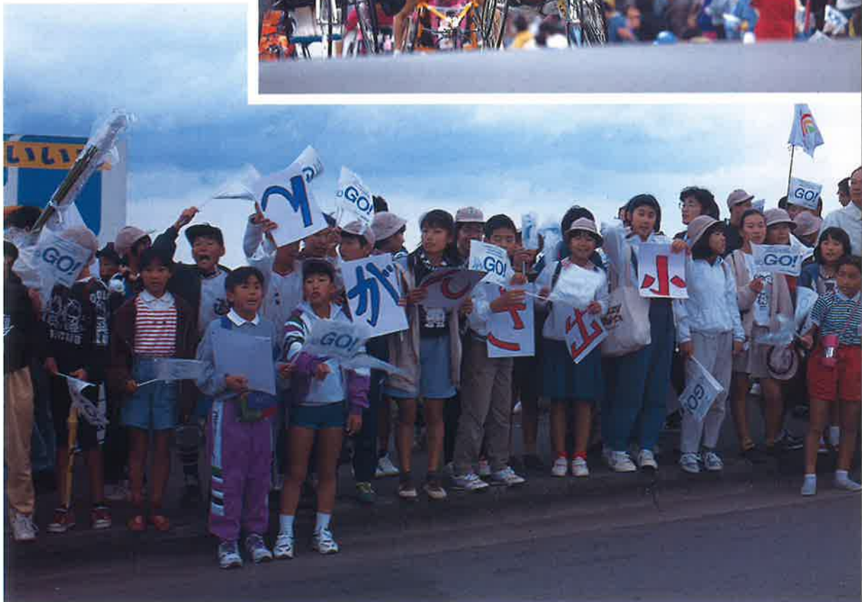
大道小学校生徒による応援