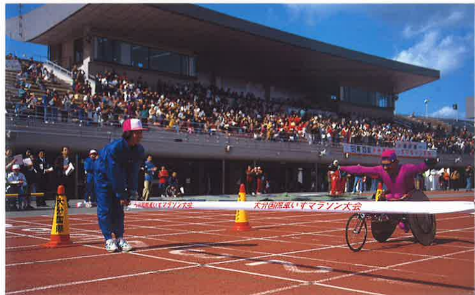
ハーフマラソン男子優勝 ホルヘルナ・セペダ選手(メキシコ)