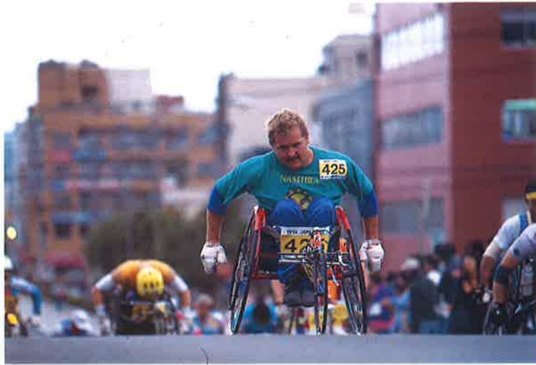
425 ペンドリカス・ズワート選手(ナミビア)