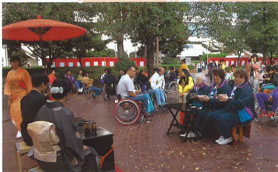
開会前に野点を楽しむ