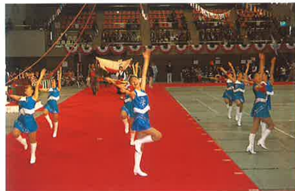
大分東明高校バントワラズ