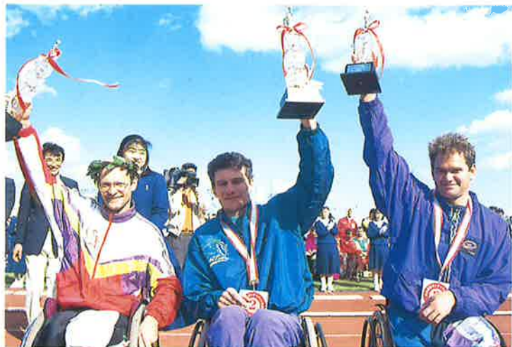
マラソン男子 | 1位～3位入賞者