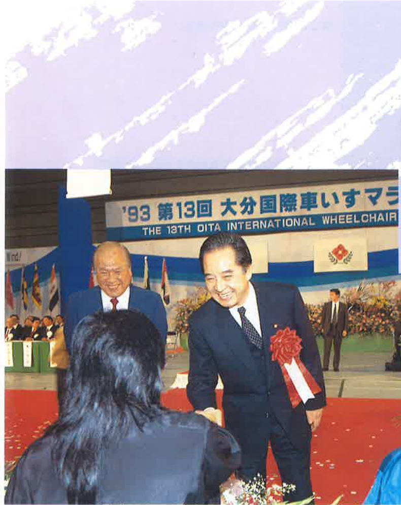
選手を激励する大内厚生大臣(右)と平松知事(左)