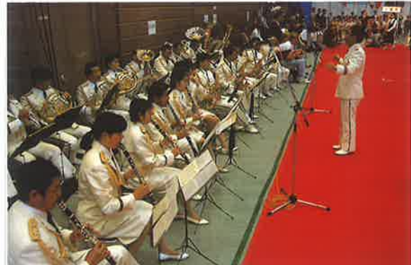
大分県警察音楽隊