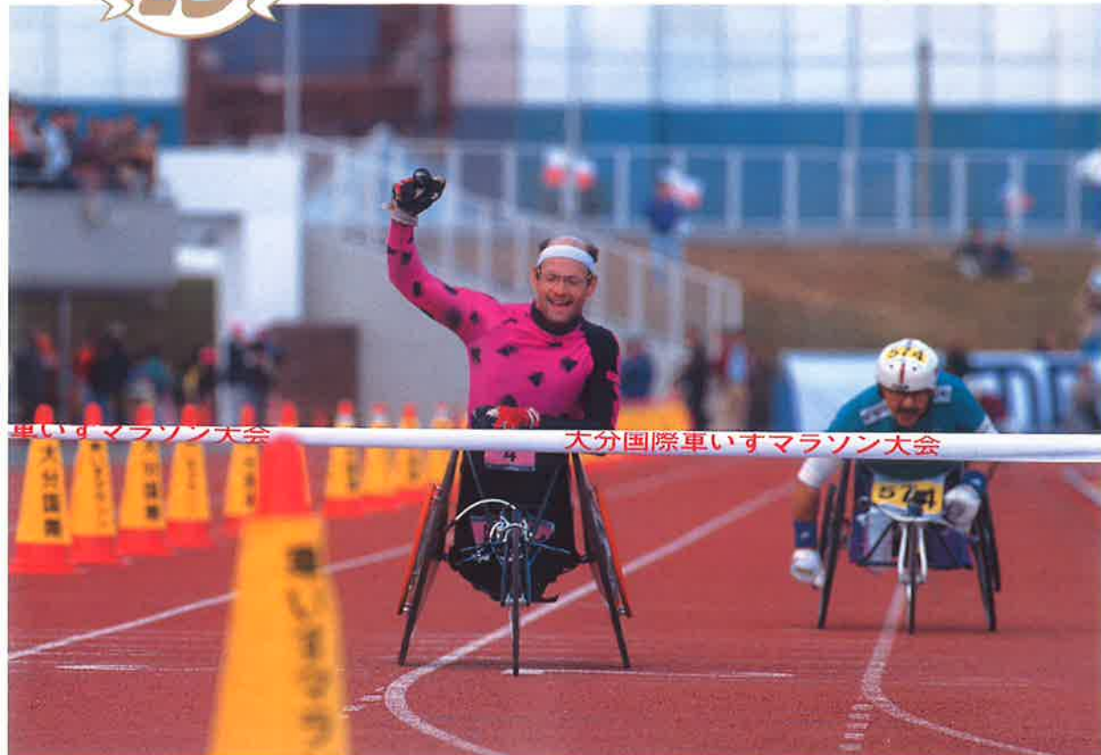
マラソン男子優勝