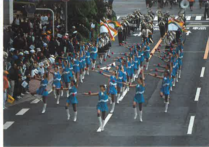
大分東明高校バントワラーズ・プラスバンド