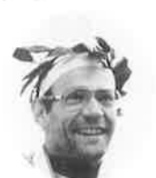
マラソン総合第1位 ハインツ フレイ(スイス) Heinz Frei (Switzerland)