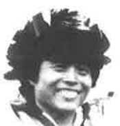
ハーフマラソン女子総合第1位 ピン チョー(香港) Ping Cho (Hong Kong)