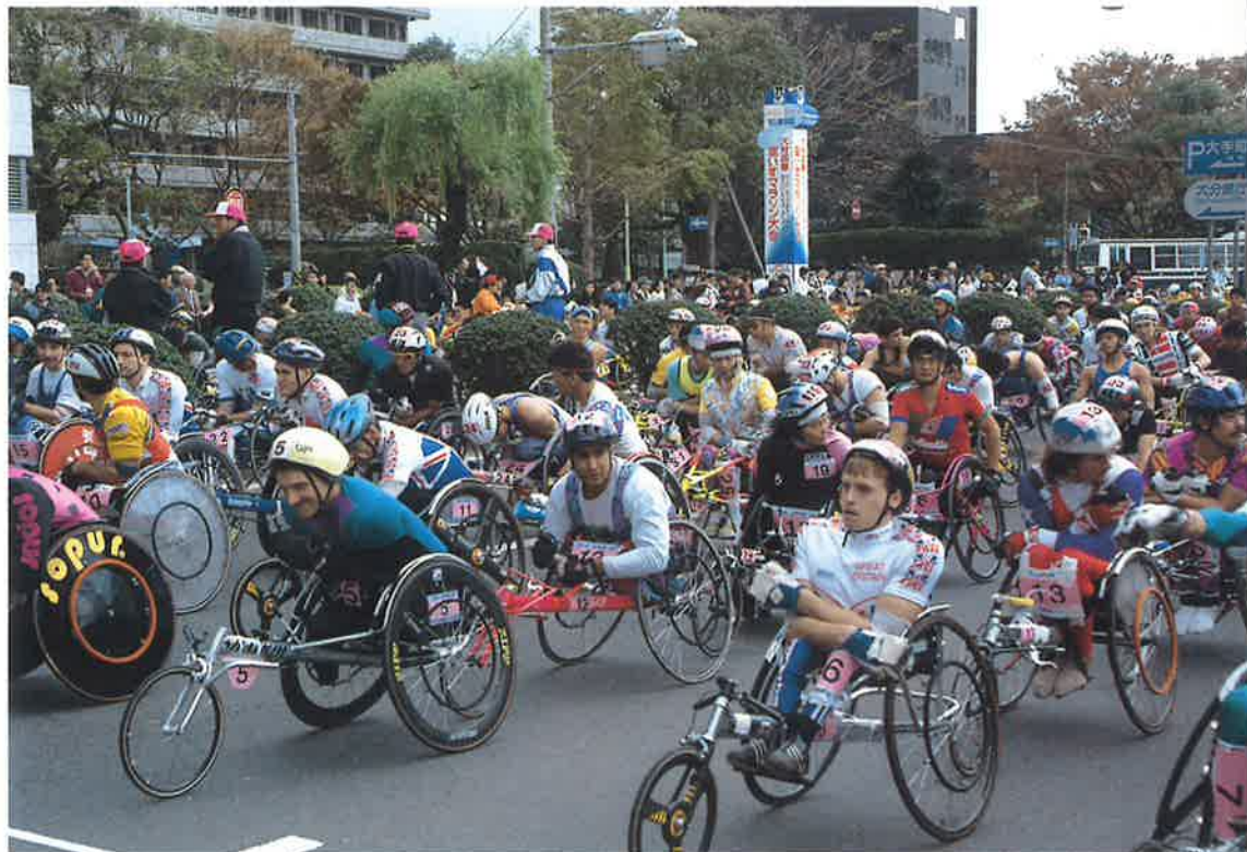
スタート地点に整列し、号砲を待つ選手