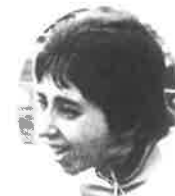
マラソン女子総合第1位 アンジェラ イェリティ(カナダ) Angela Ieriti (Canada)