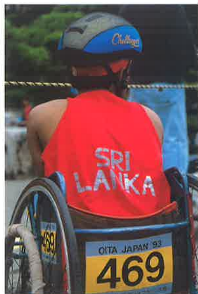
469 カビカラ・ドゥシャント選手 (スリランカ)