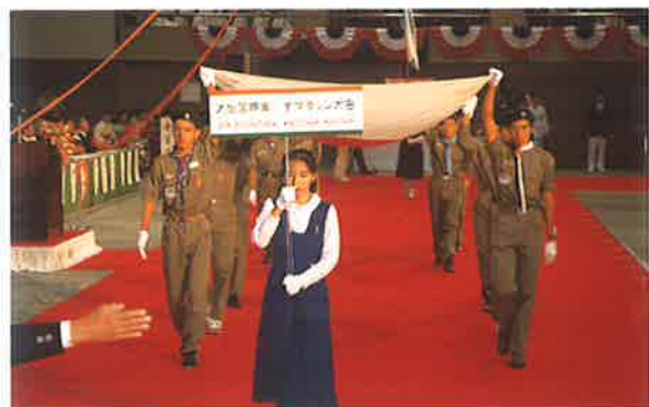
日本ボーイスカウト大分県連盟