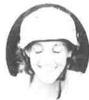
マラソン女子総合第1位 キャンデス ケーブル(アメリカ) Candace Cable (U.S.A.)