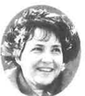
マラソン女子総合第1位 ガブリエル シルト(スイス) Gabriele Schild (Switzerland)