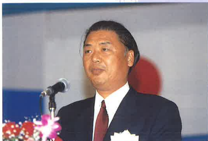
歓迎あいさつ 大分市長 木下敬之助