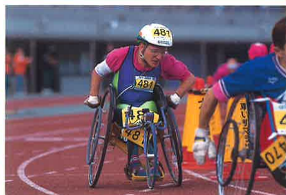
481 パトリック・フィルダー選手 (ベルギー)