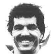
マラソン総合第1位 アンドレ ヴィジェ(カナダ) Andre Viger (Canada)