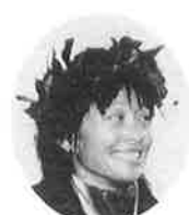
マラソン女子総合第1位 リリー アングレニー(ドイツ) Lily Anggreny (Germany)