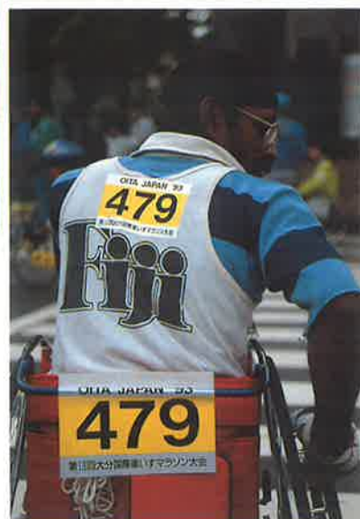
479 ペニアン・ドバイ選手 (フィジー)