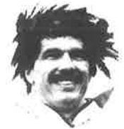
マラソン総合第1位 アンドレ ヴィジェ(カナダ) Andre Viger (Canada)