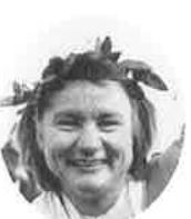
マラソン女子総合第1位 モニカ ベテルストロン(スウェーデン) Monica Wetterstrom (Sweden)