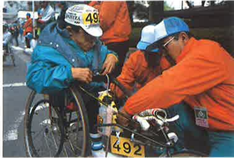
選手整列（大分文化会館前） 左上は新築された大分県共同庁舎