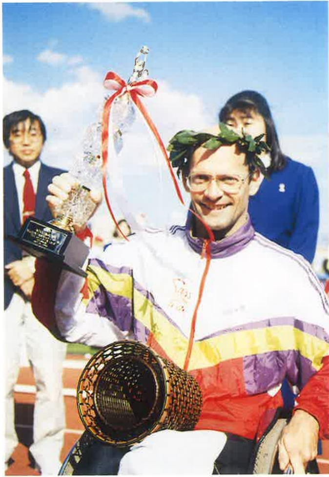
マラソン男子優勝 ハイツ・フレイ選手（スイス）