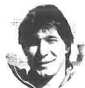
ハーフマラソン総合第1位 リック ハンセン(カナダ) Rick Hansen (Canada)