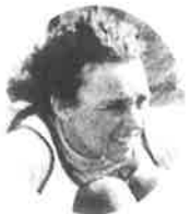
マラソン女子総合第1位 キャンデス ケーブル(アメリカ) Candace Cable (U.S.A.)