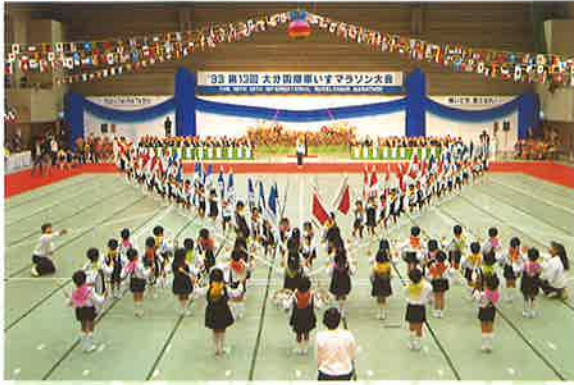
千代町幼稚園児による演技