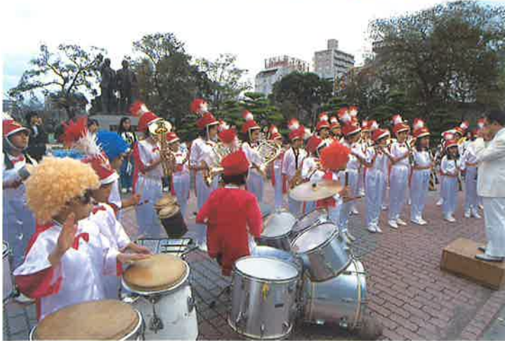
荷揚町小学校ウィンドアンサンブル