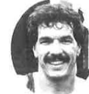
マラソン総合第1位 アンドレ ヴィジェ(カナダ) Andre Viger (Canada)