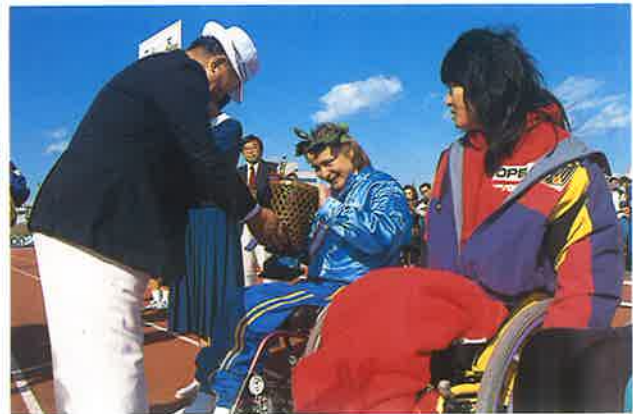
表彰 大分市助役 加賀 稔豊