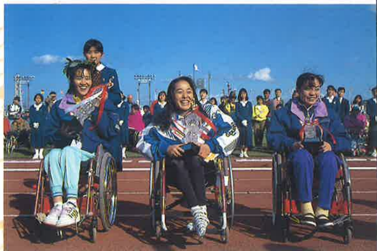
ハーフマラソン女子 | 1位～3位入賞者